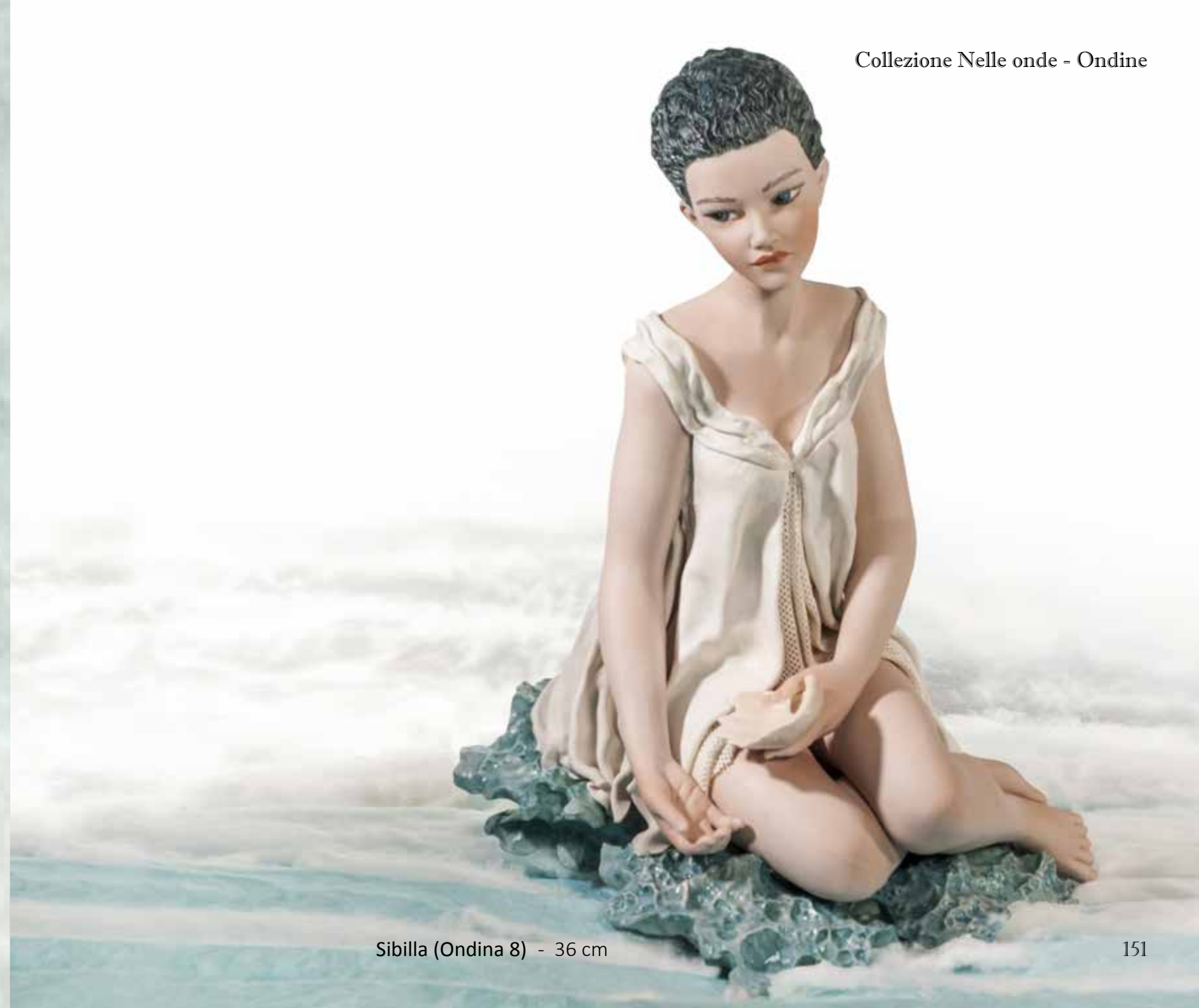
Sibilla (Ondina 8) - 36 cm