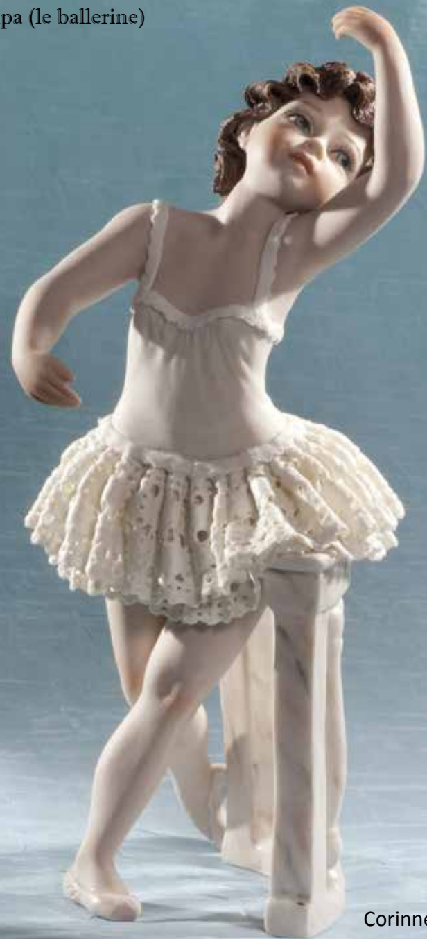
Corinne - 24,5 cm