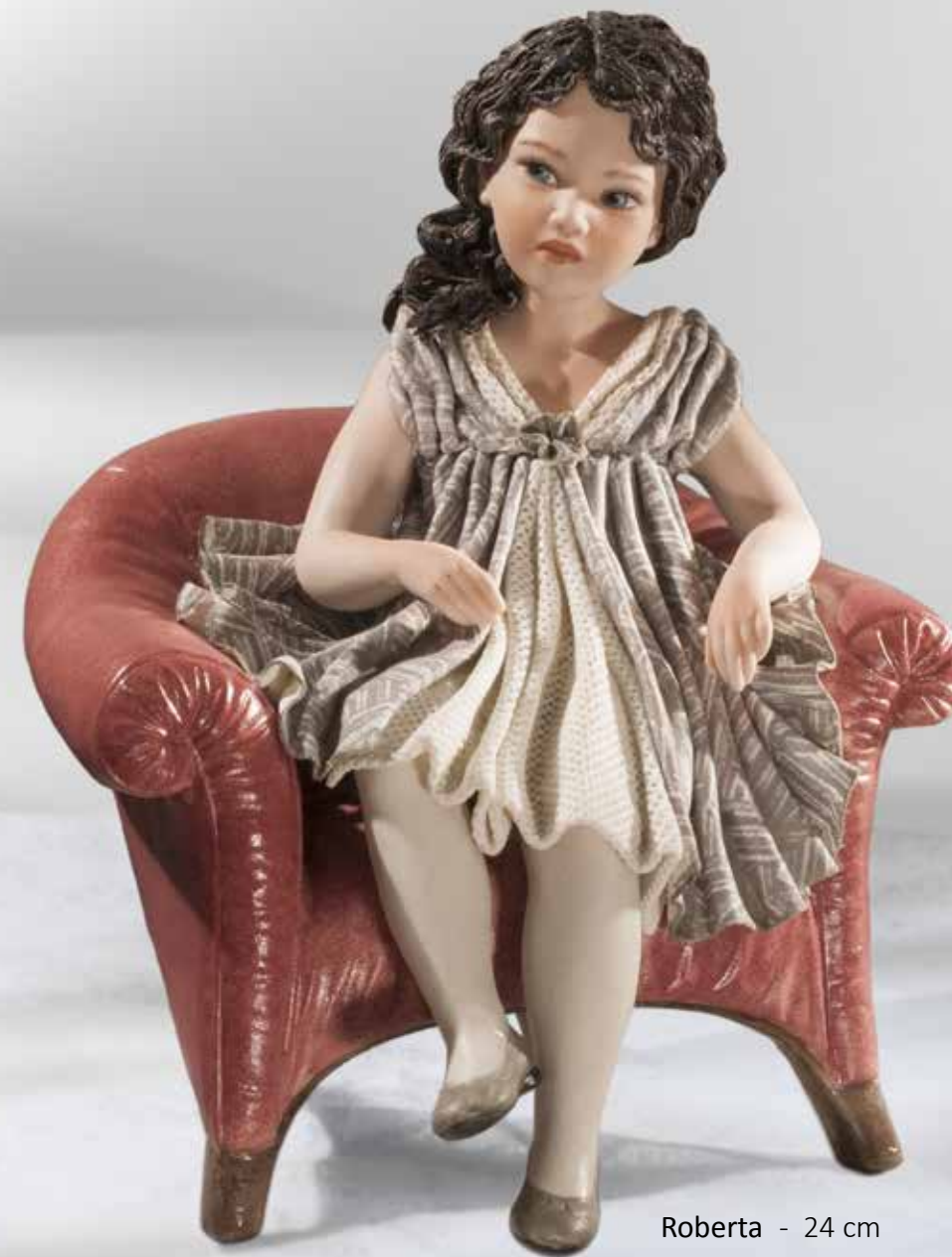
Roberta - 24 cm