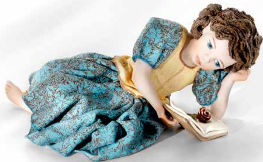
La Bella e la Bestia - 8,5 cm