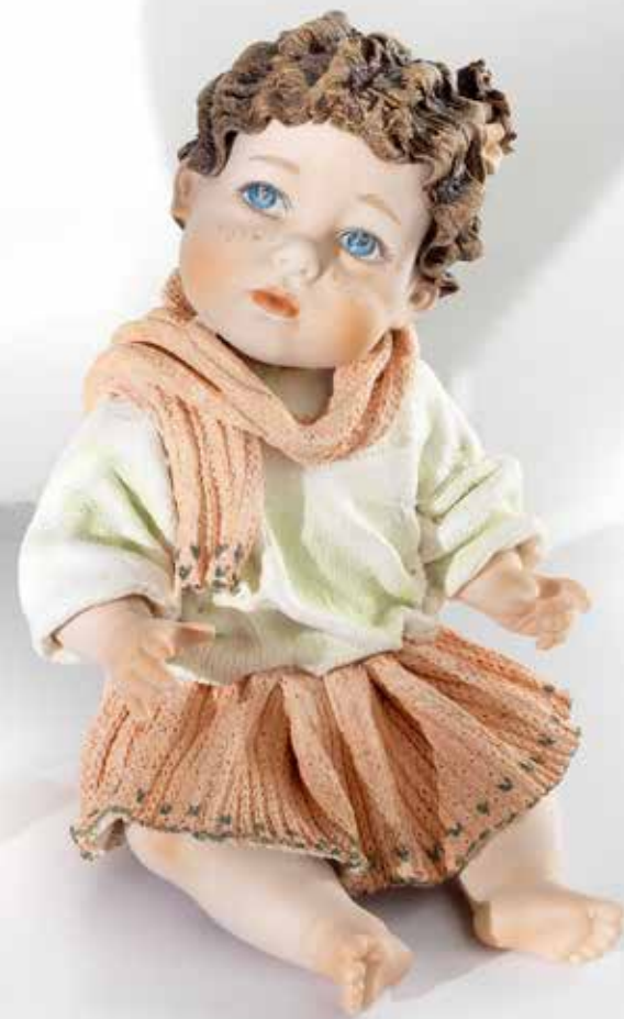
Bessie - 17 cm