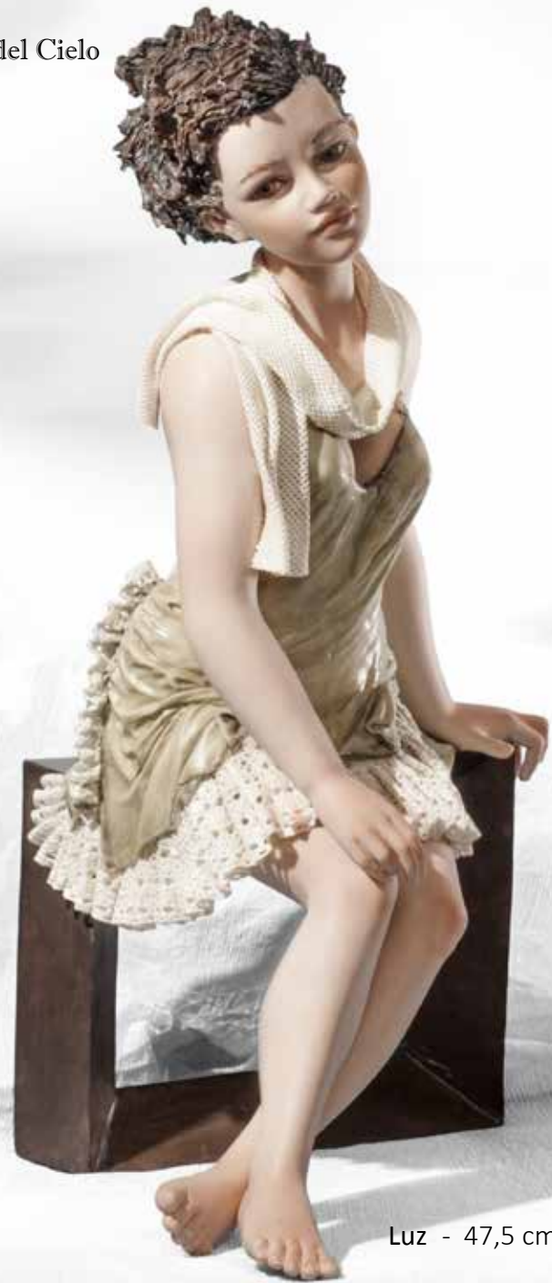
Luz - 47,5 cm

Chi è quel che per forza a te mi mena, oilmè, oilmè, oilmè, legato e stretto, e son libero e sciolto?