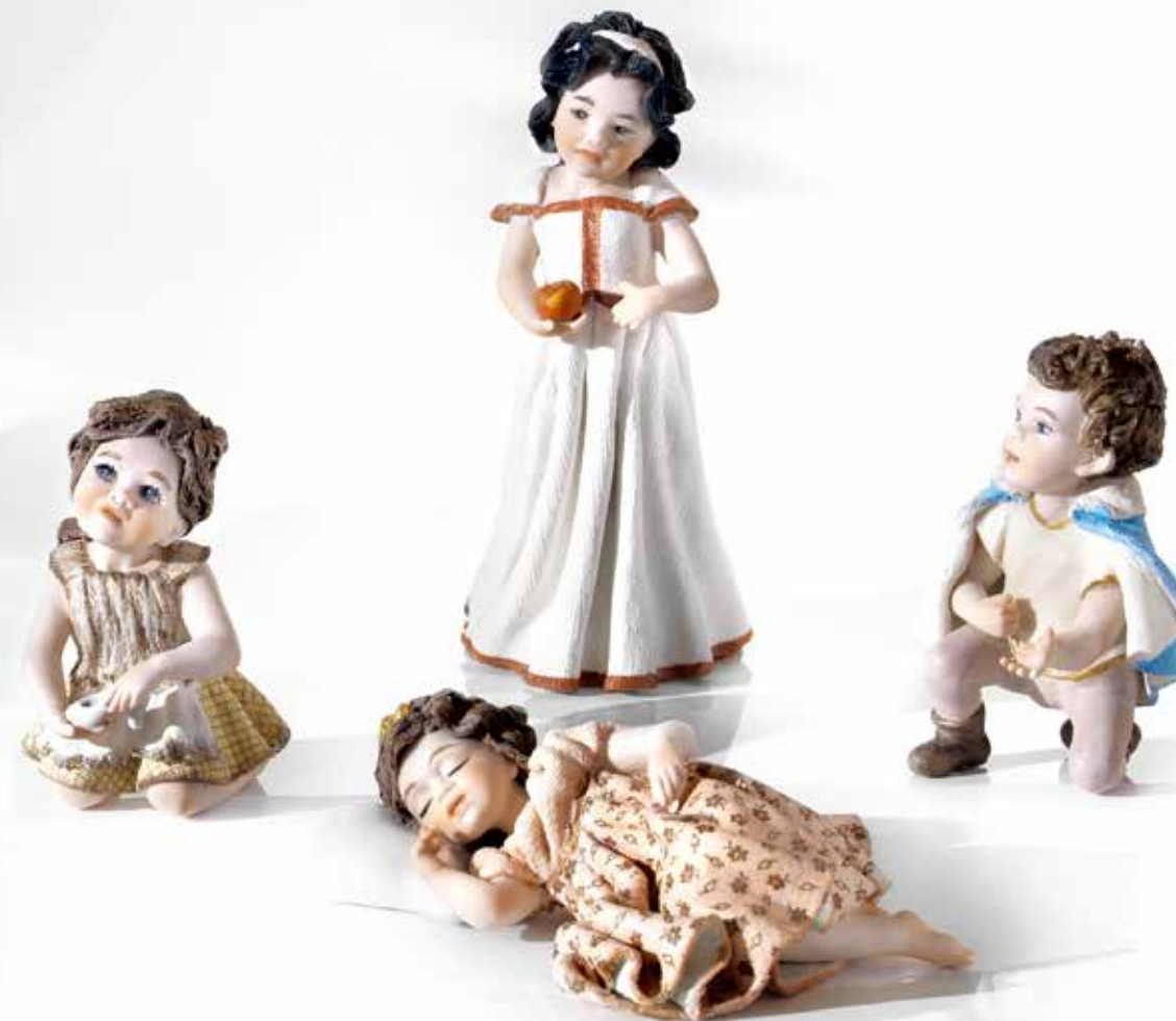
Principe azzurro mini - 9 cm