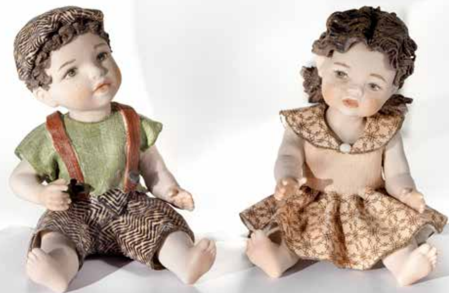
Larry - 10,5 cm