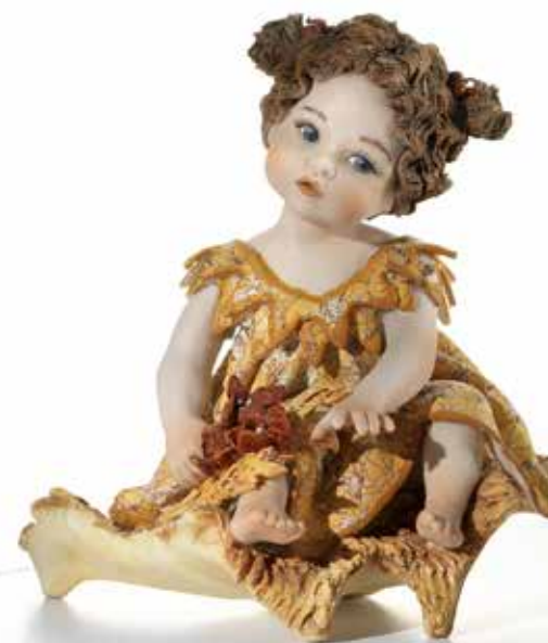
Estate - 12,5 cm