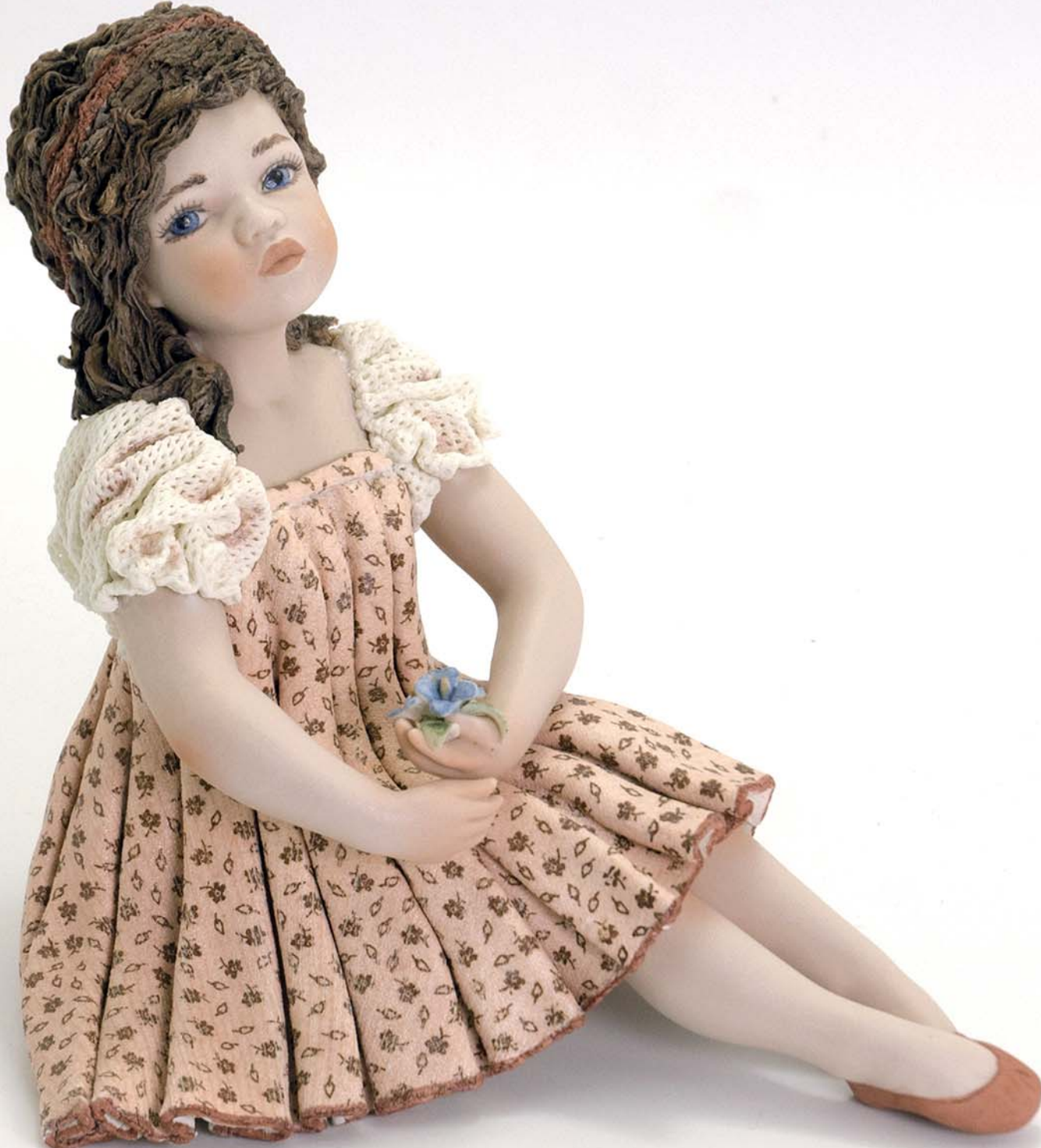
Betty 15 cm