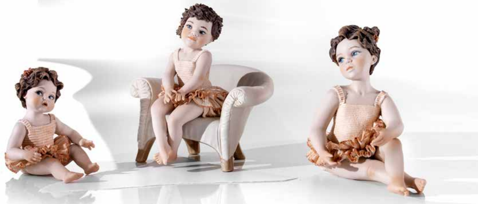
112 Renée - 10 cm