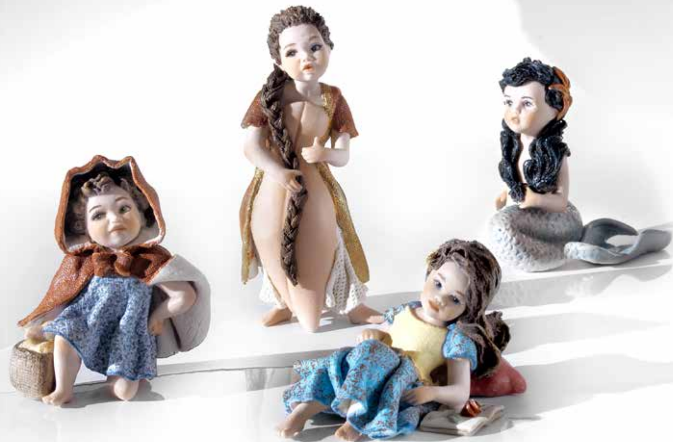
La sirenetta mini - 9 cm