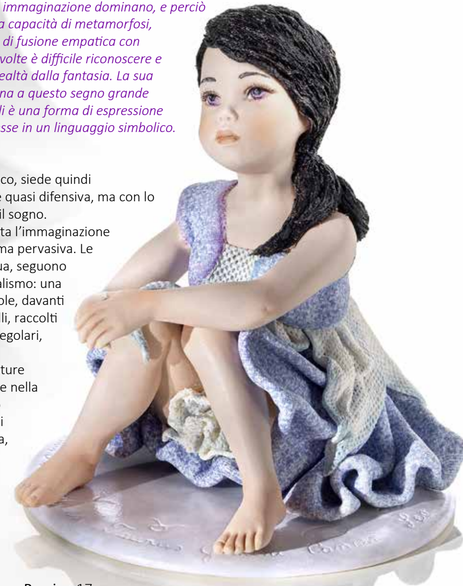
Pesci - 17 cm