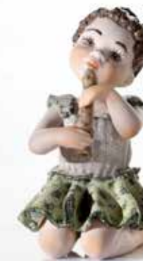
Erica - 7,5 cm