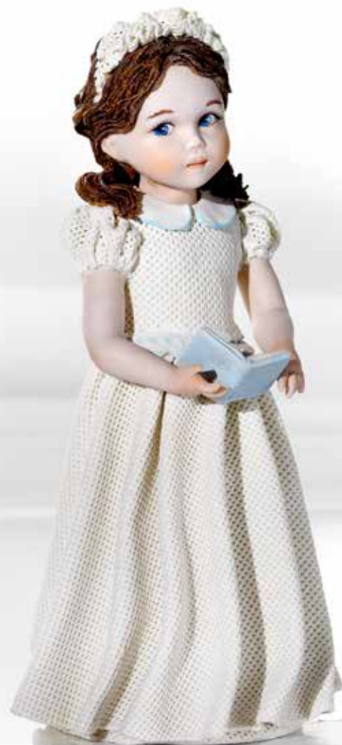
Comunione 6 - 24,5 cm