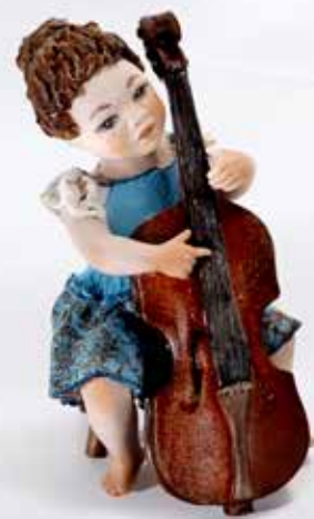
Bice - 9 cm