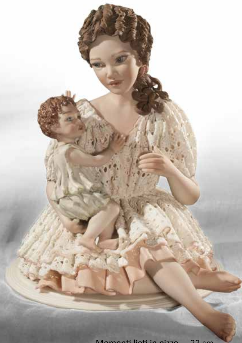
Momenti lieti in pizzo - 23 cm