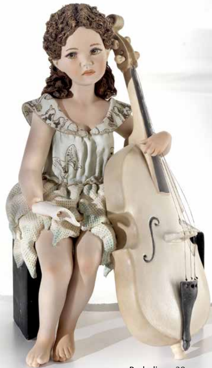
Preludio - 30 cm