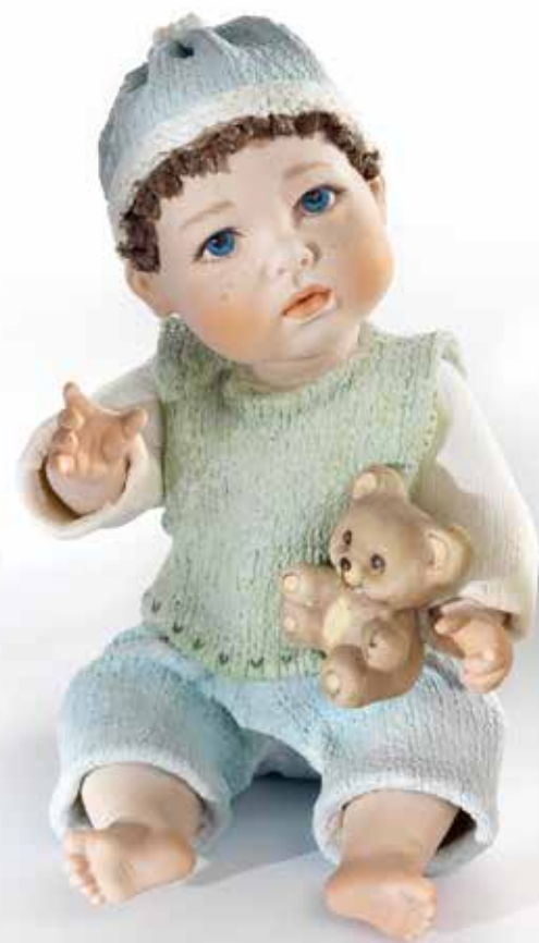
Teddy - 17 cm