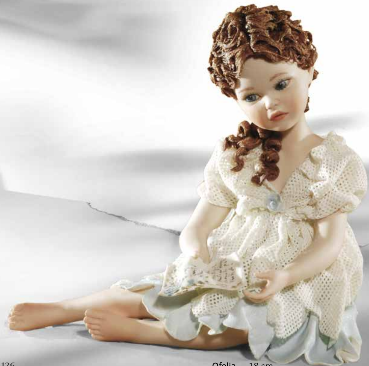
Ofelia - 18 cm