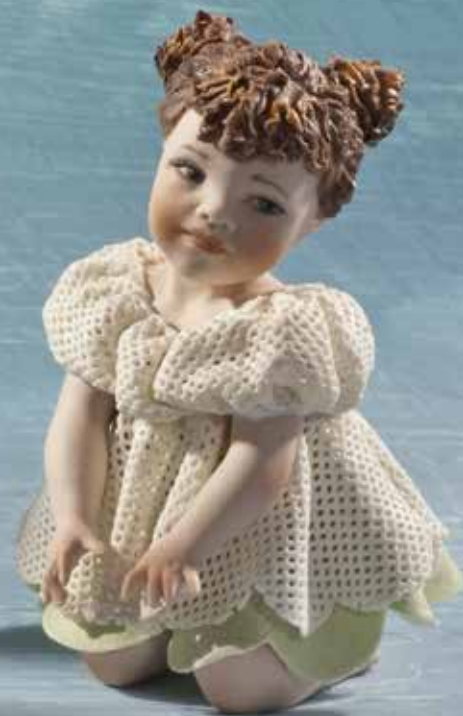
Violetta - 11,5 cm