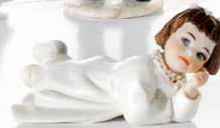
Comunione 1 - 4 cm