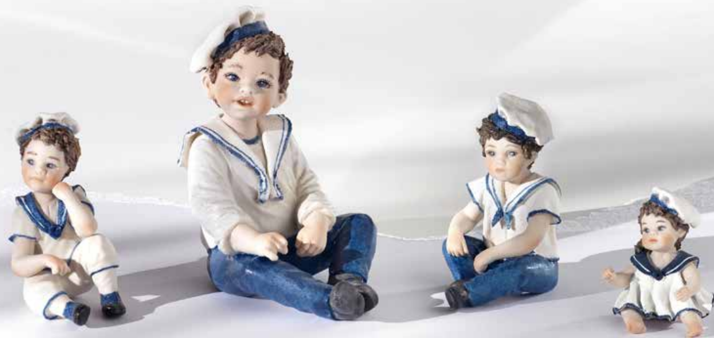
148 Remo - 8 cm