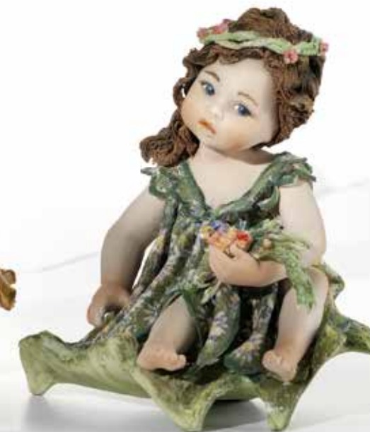
Primavera - 12 cm