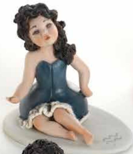
Pesci mini - 7,5 cm