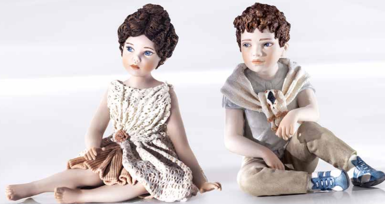
Dalia - 18 cm