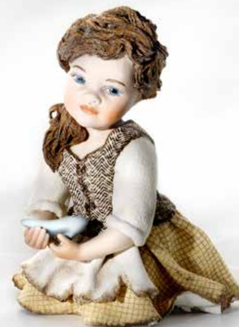
Cenerentola - 11,5 cm