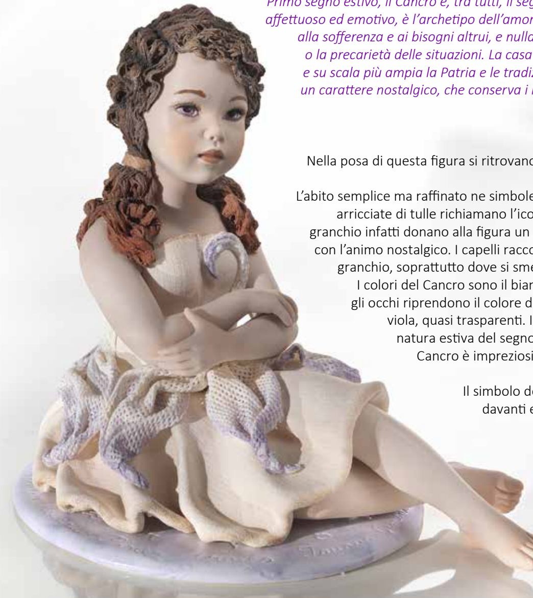
Cancro - 18 cm

Il simbolo del Cancro infine è nascosto nel corpetto, davanti e dietro, dove sull'orlo superiore arcuato si appoggiano due riccioli di tulle.