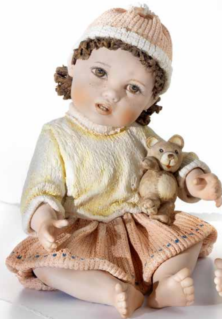
Zoe - 19 cm