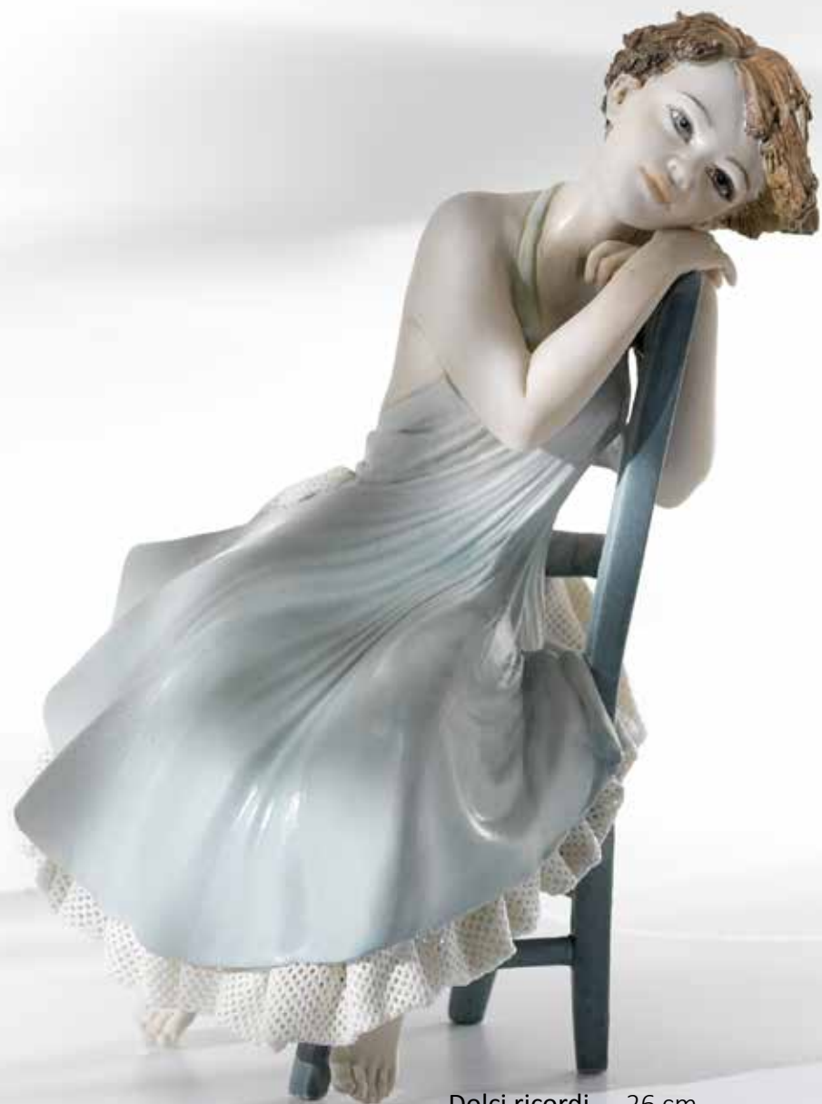
Dolci ricordi - 26 cm