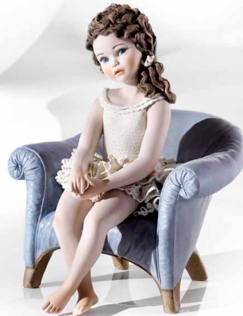
Ileana - 25,5 cm