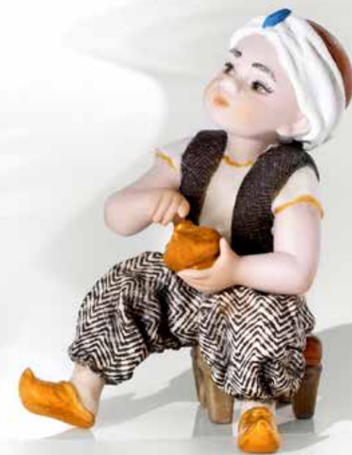
Aladino - 12 cm