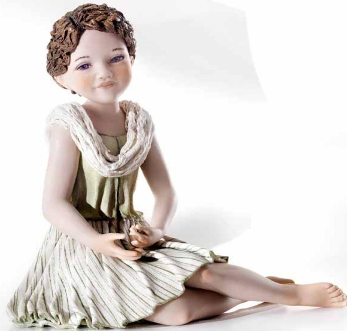
Gilda - 23 cm