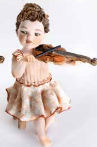
Vera - 10,5 cm