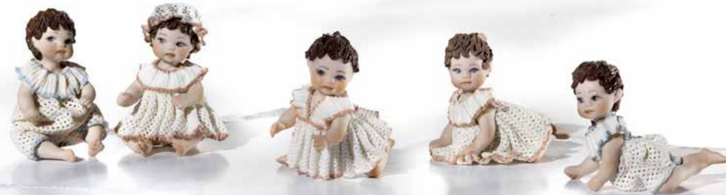
Micro M e Micro F - 5,5 cm