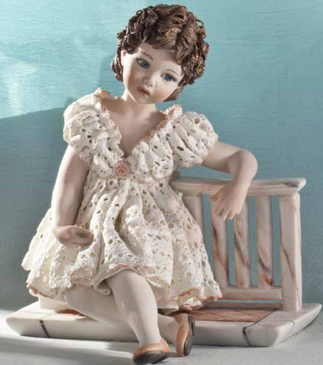
Tess - 21 cm