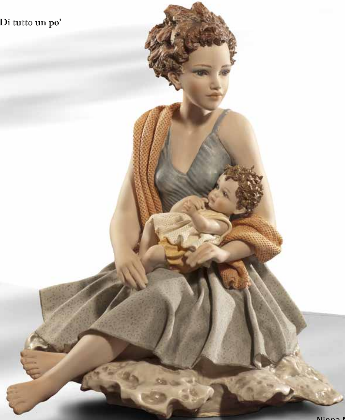
Ninna Nanna - 35 cm