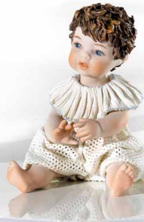
Paco - 11 cm