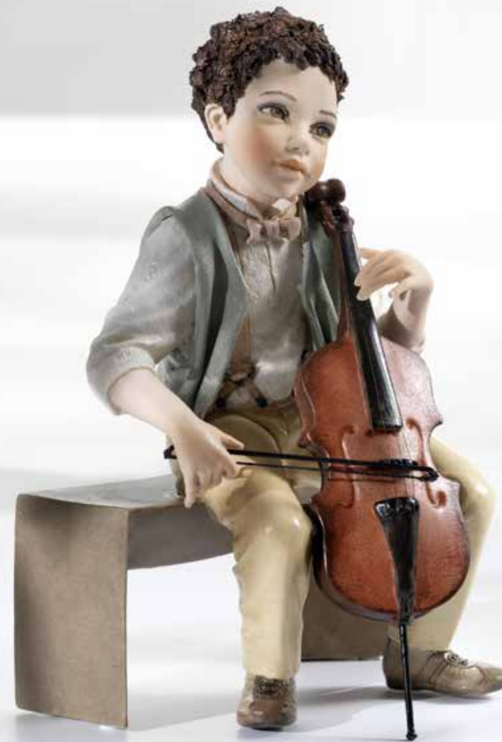
Notturmo - 27,5 cm