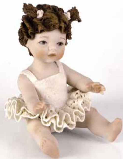
169 ballerina - 9,5 cm