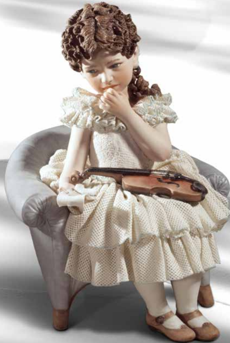
Costanza - 28 cm

La porcellana è l'oro bianco che Marco Polo portò in occidente dal misterioso Catai.