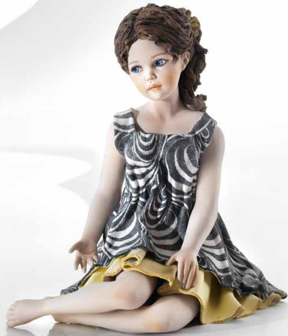
Elisabetta - 24 cm