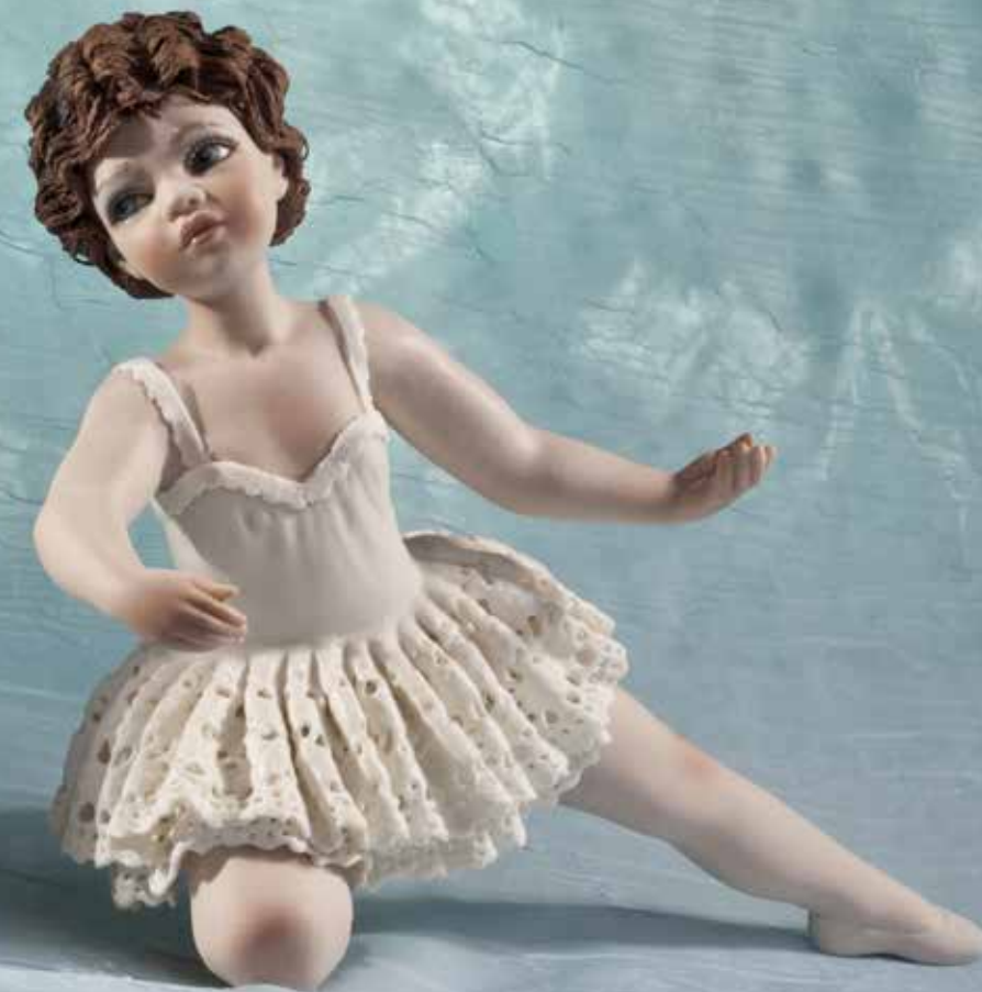
Babette - 19 cm