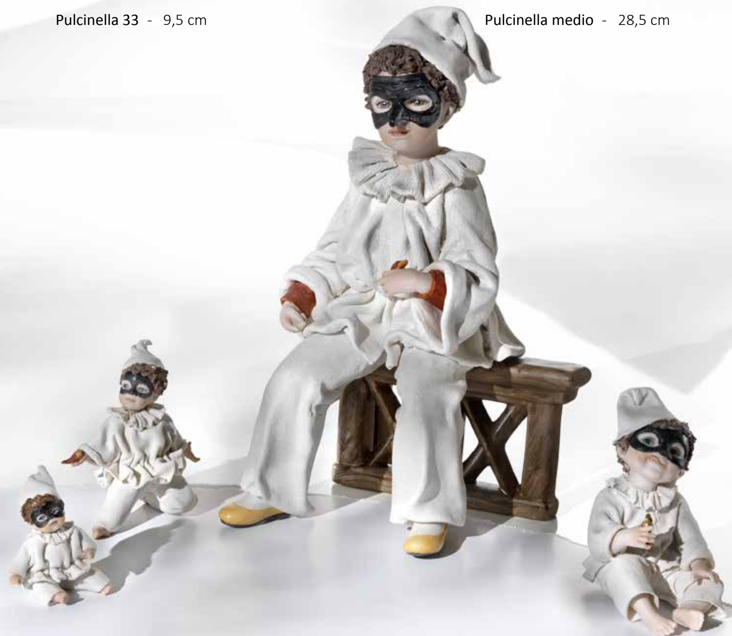
204 Pulcinella mignon - 6,5 cm