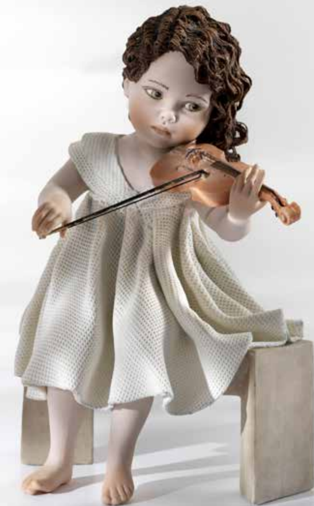
Minuetto - 27,5 cm