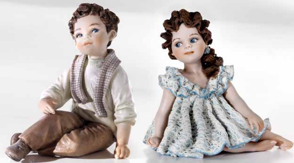
Riccardo - 12 cm