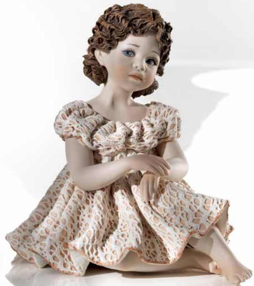
Sabrina - 17,5 cm