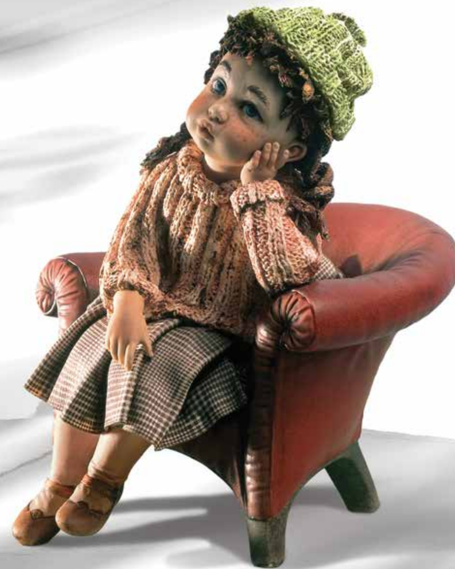
Francesca - 25,5 cm