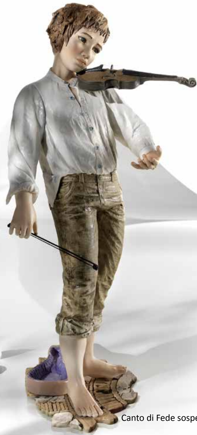
Canto di Fede sospeso - 60 cm