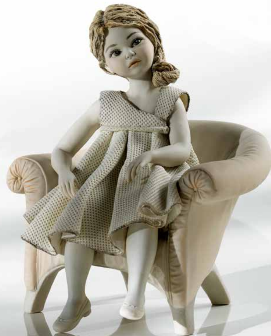
Lund - 24,5 cm