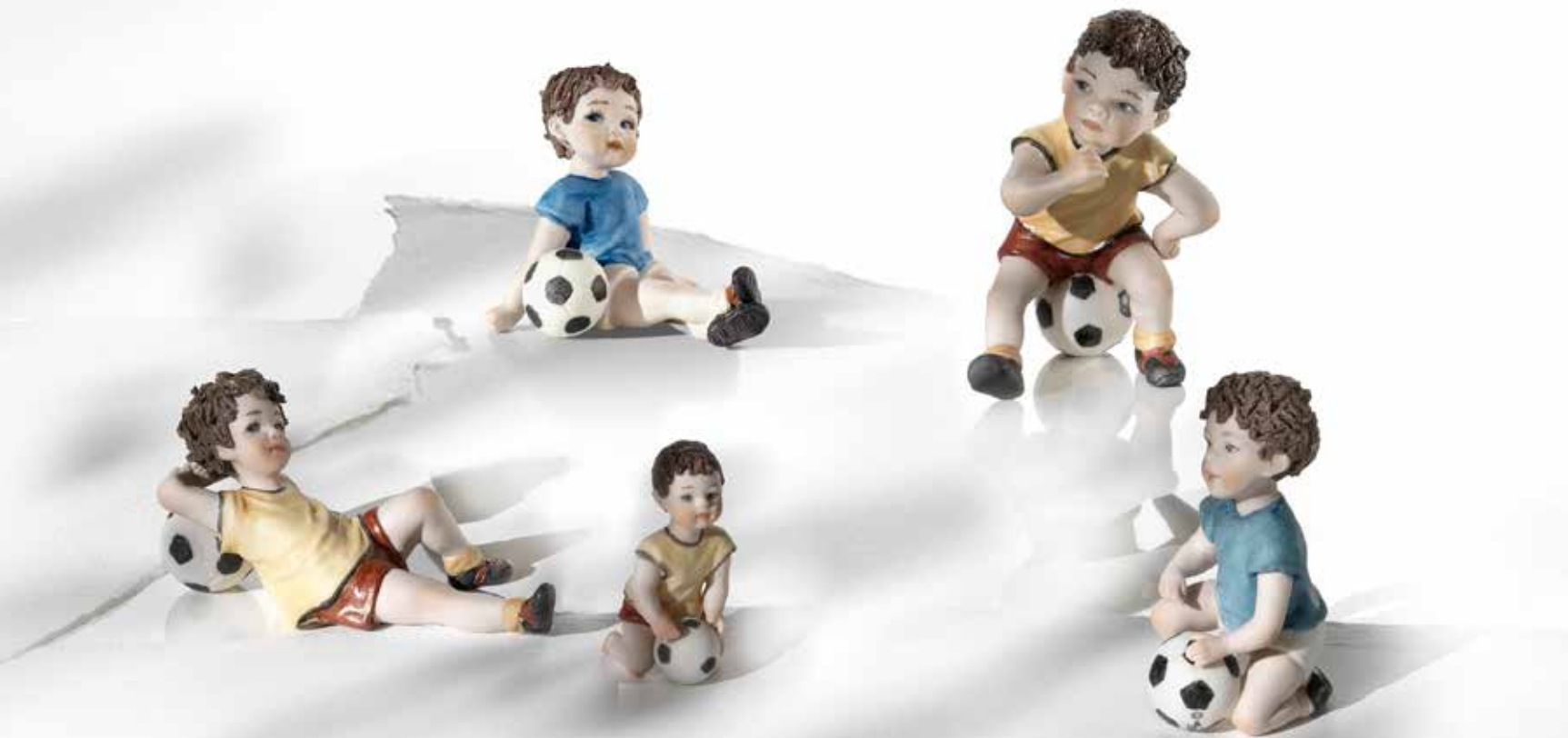
Chips - 11,5 cm