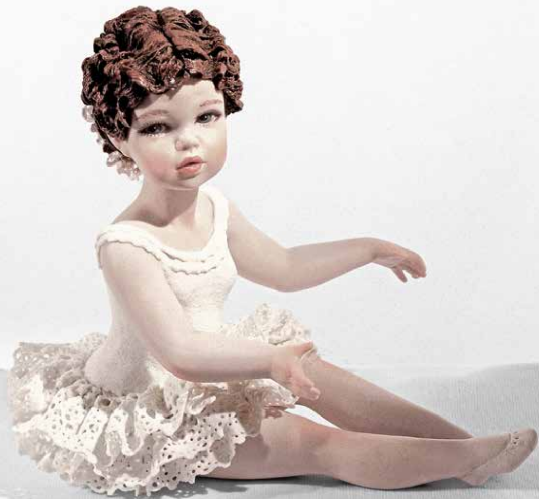
Carolyn - 17 cm