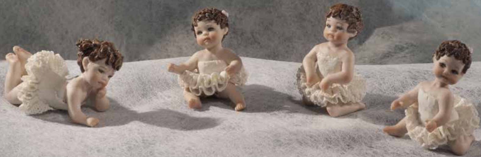
98 Ada petipa - 5 cm