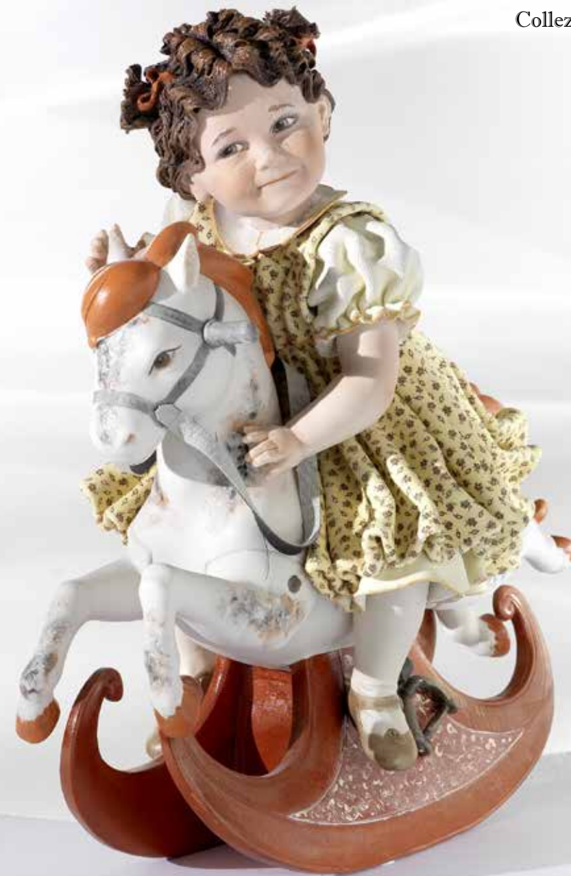
Sissy - 33 cm