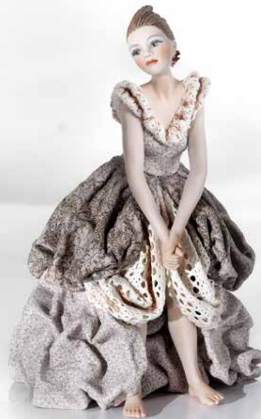
Dama 9 - 23 cm