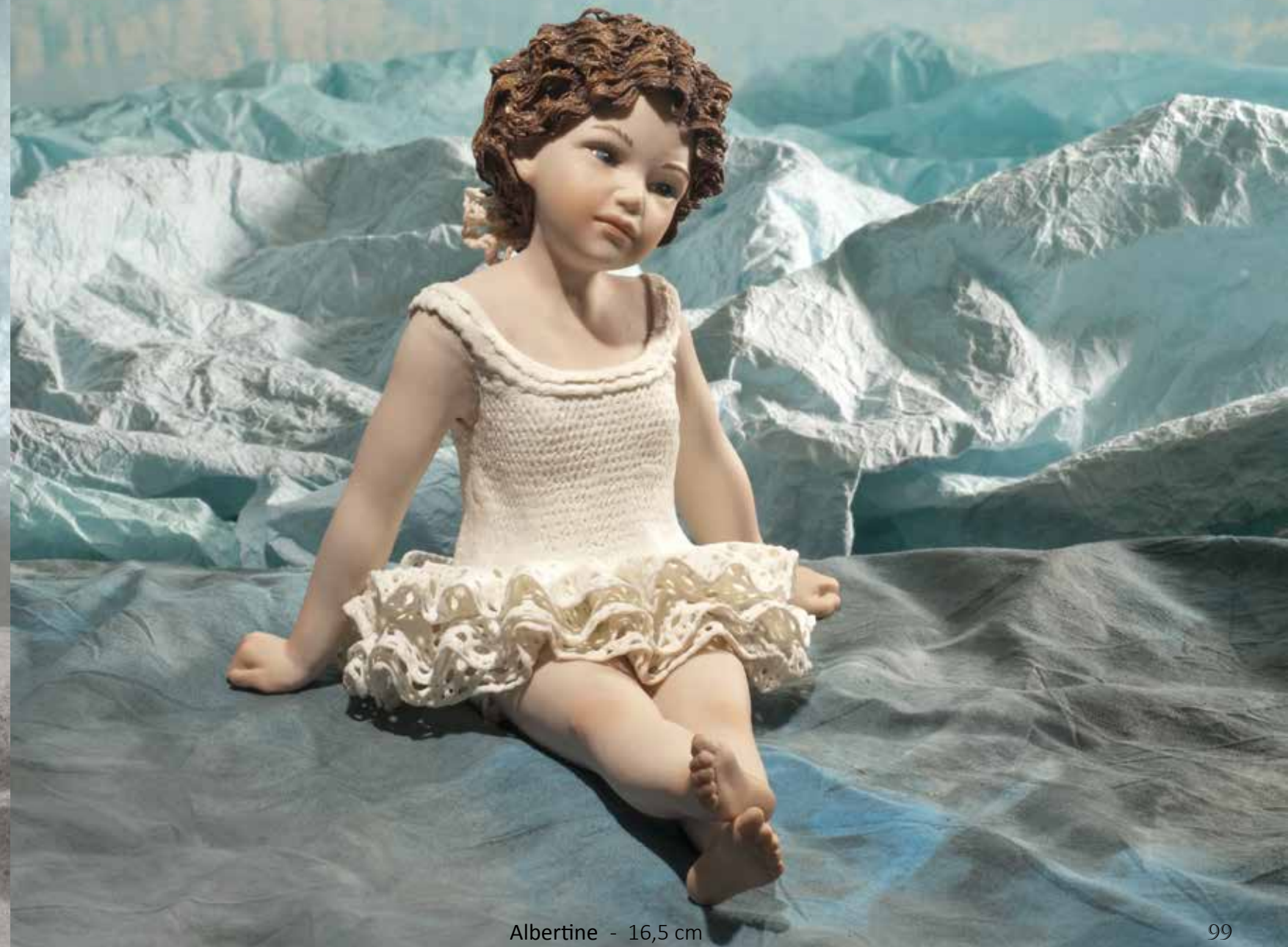
Albertine - 16,5 cm