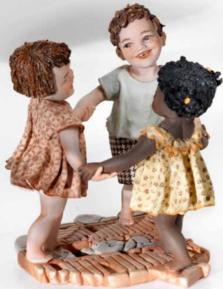
Giro-girotondo - 17 cm