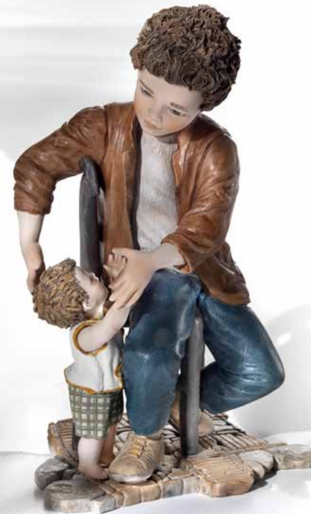
Pa-pa-papà! - 29,5 cm