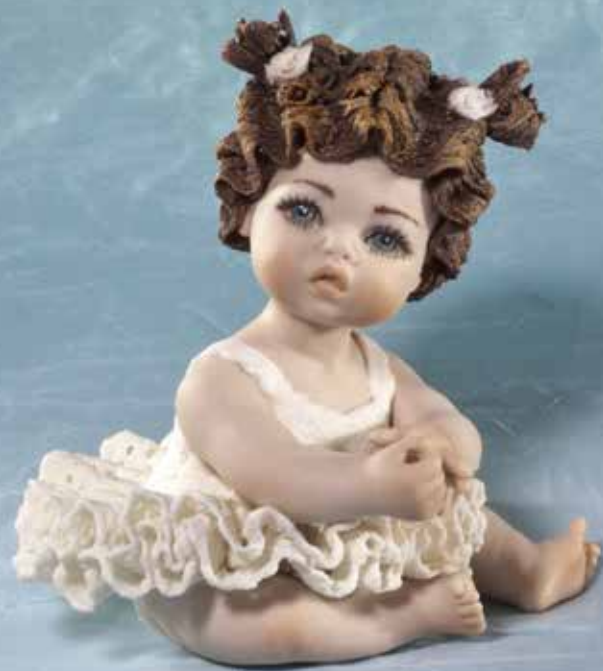
Lila - 9,5 cm