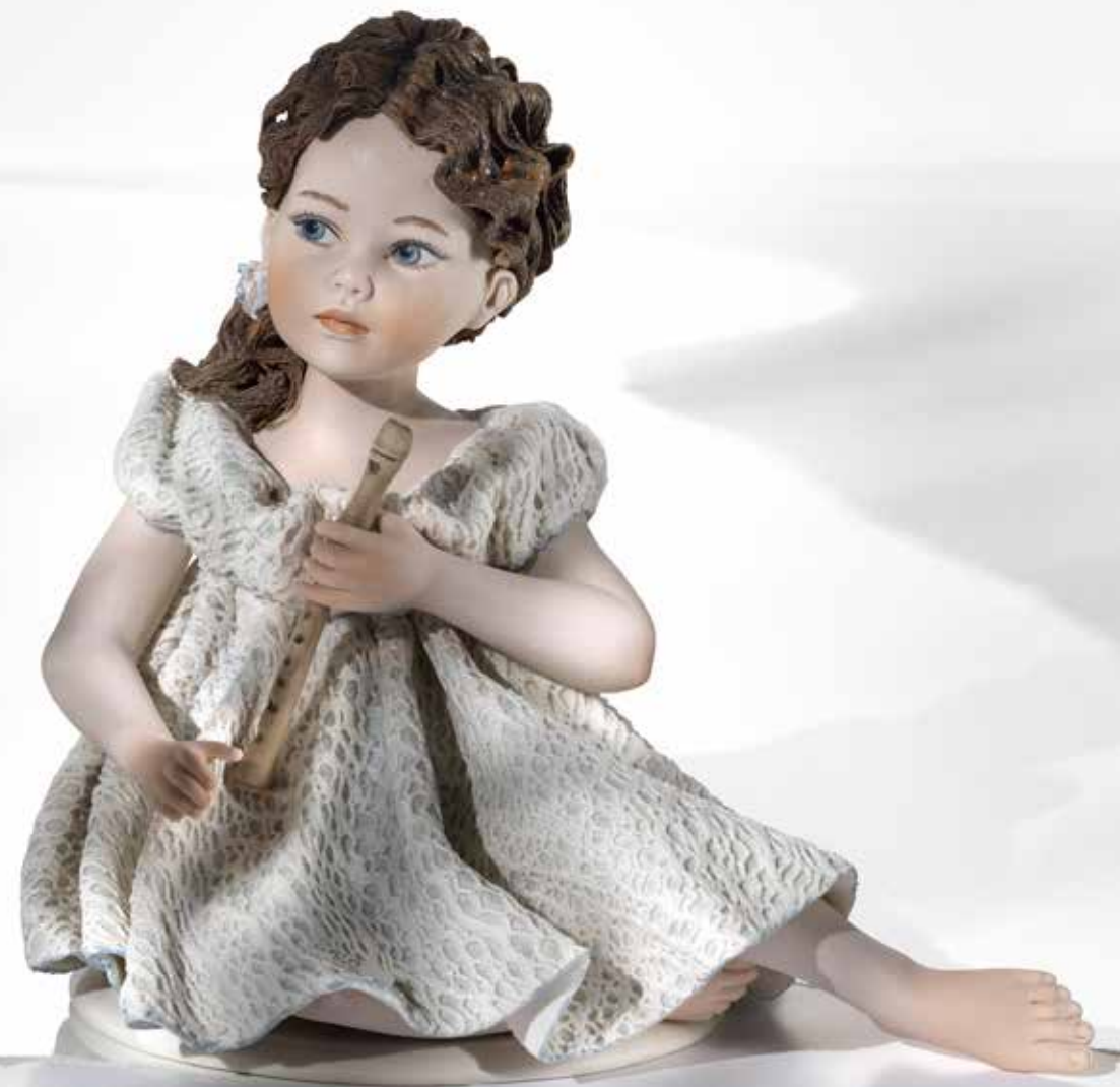
Gaia - 22 cm