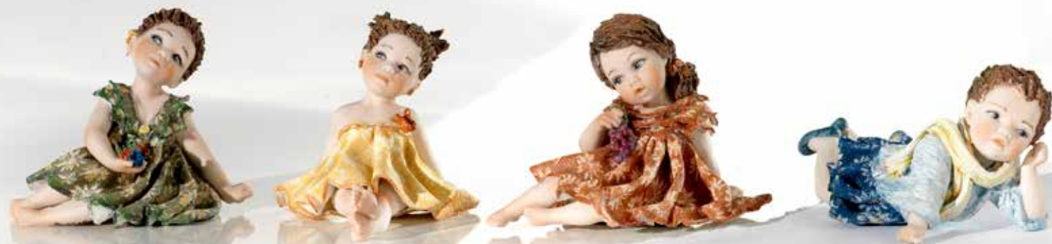
160 Primavera 33 - 7 cm Estate 33 - 7 cm Autunno 33 - 7 cm Inverno 33 - 5,5 cm