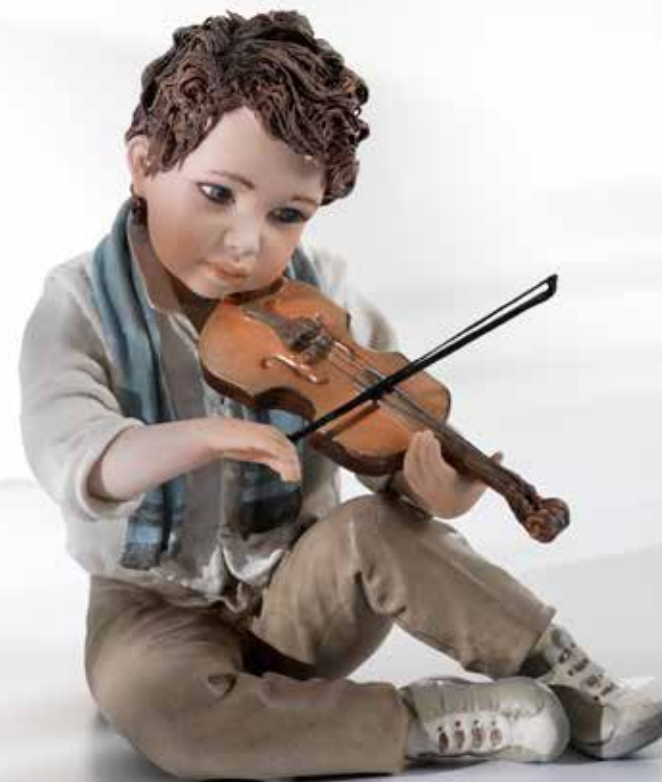
Tamino - 18 cm