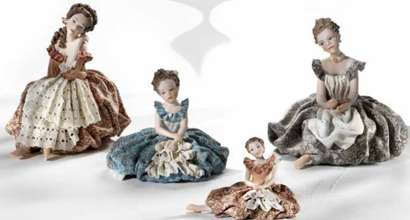
198 Dama 3 - 17 cm Dama 1 - 11 cm Dama 0 - 8 cm Dama 2 - 15,5 cm