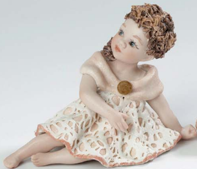
Lisy 8 cm