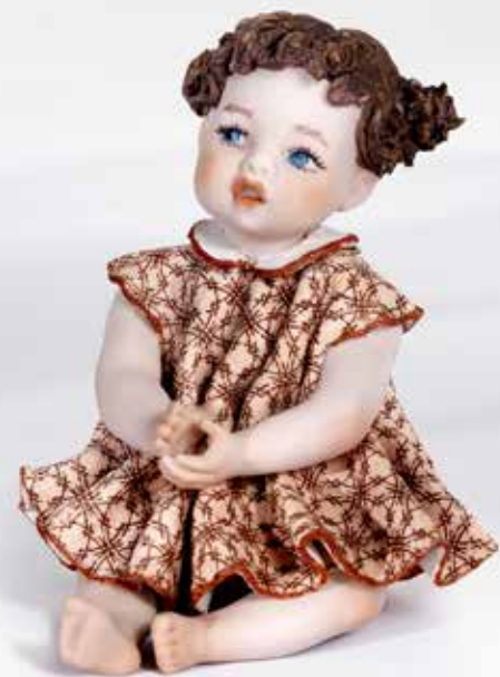
Molly - 10,5 cm