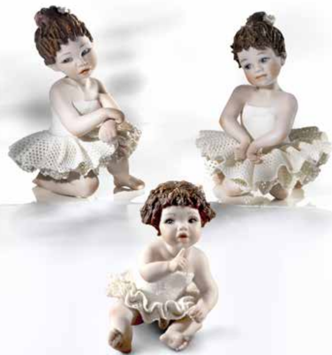
Laretta petipa - 7,5 cm