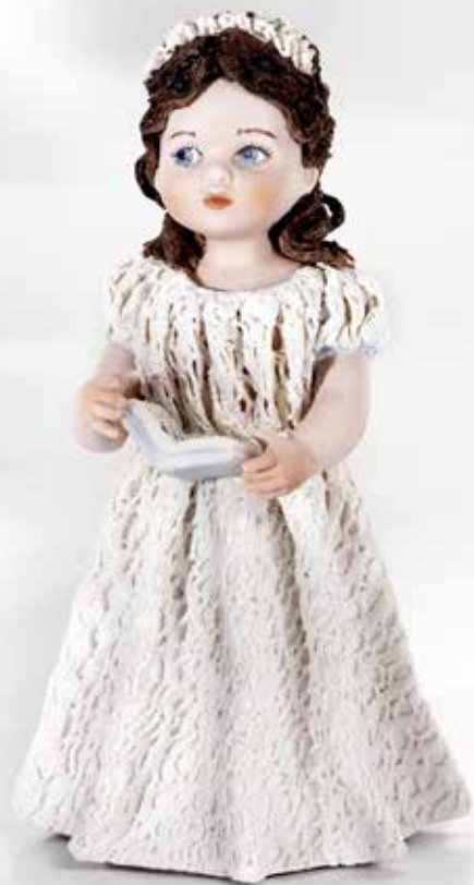
Comunione 5 - 16,5 cm