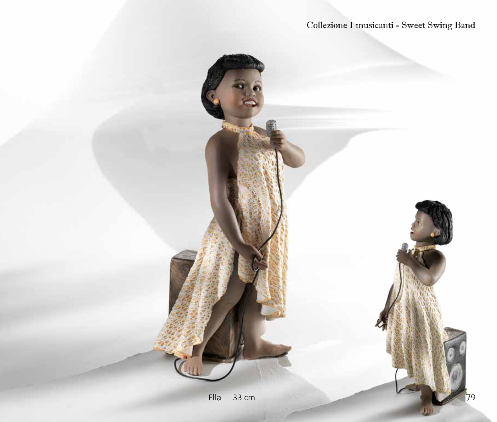
Ella - 33 cm