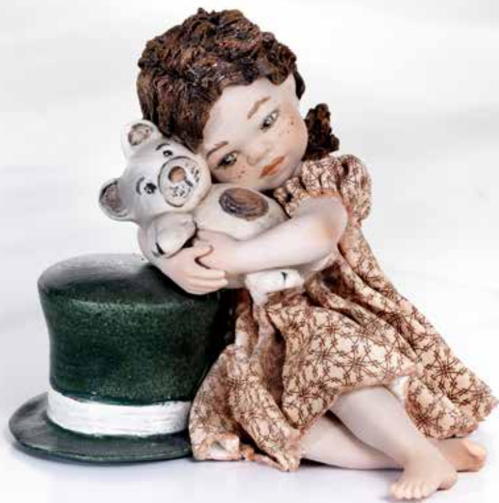
Margherita - 11,5 cm