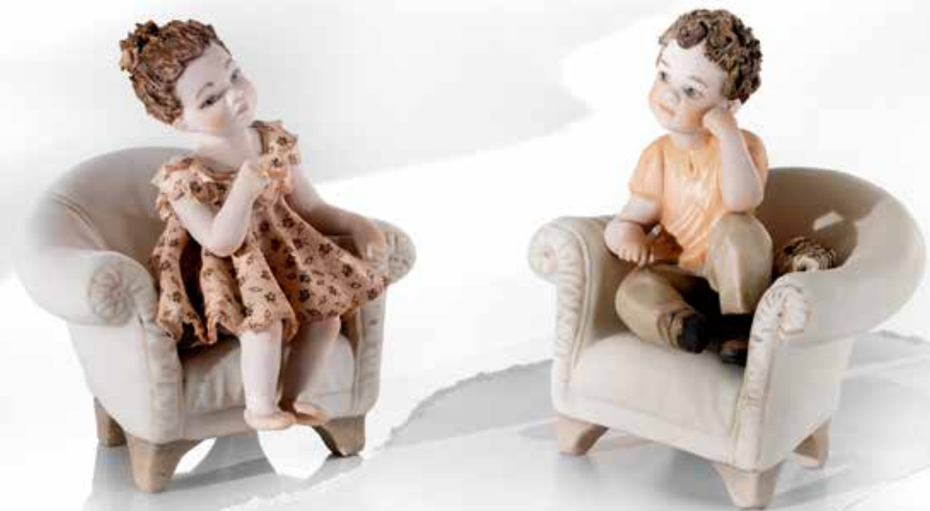
Paolina - 11 cm