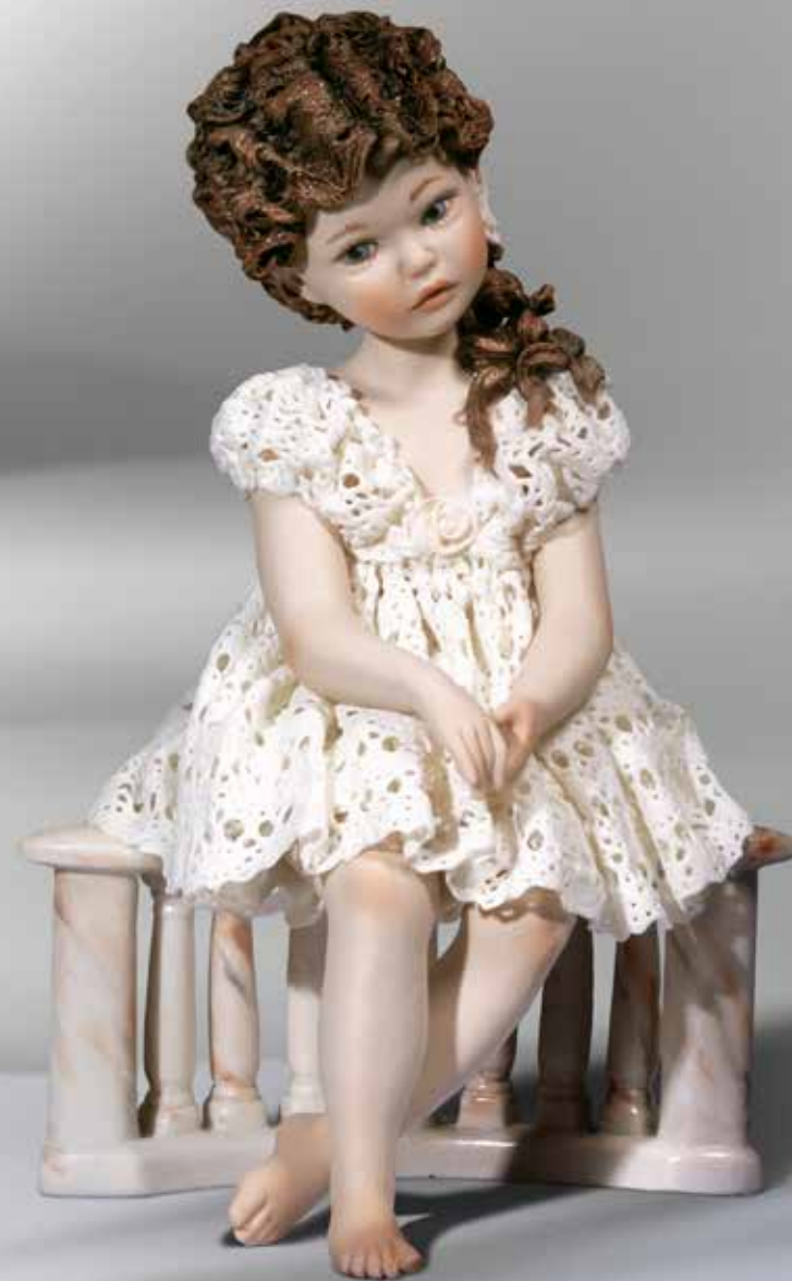
Luna - 25 cm