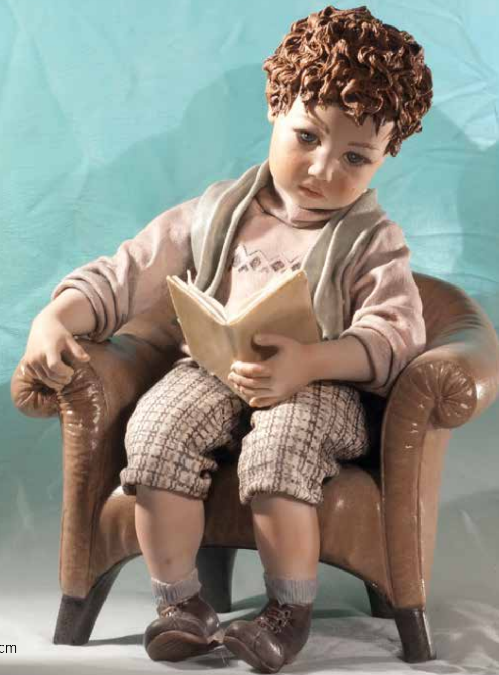
Oliver su poltrona - 32 cm