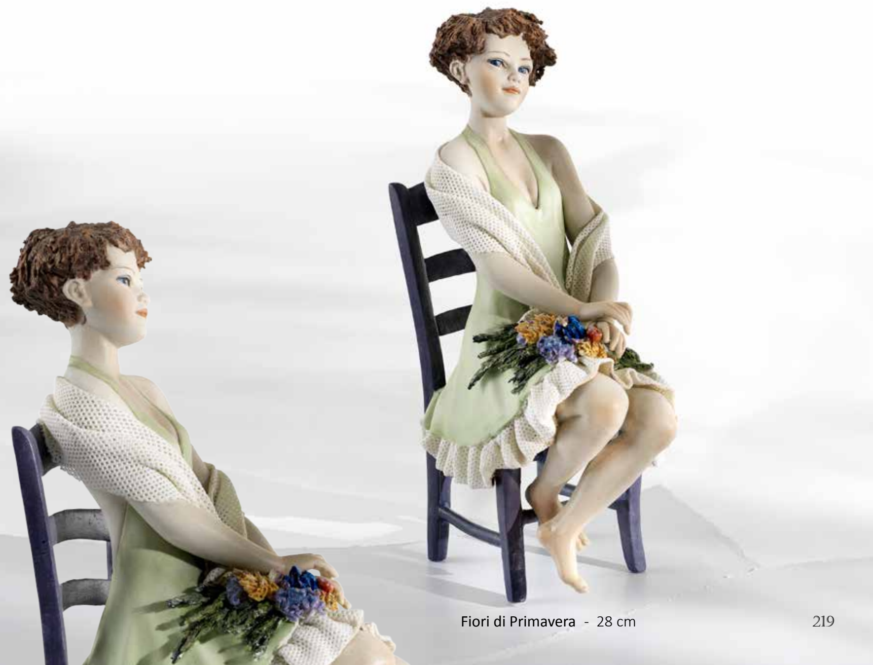
Fiori di Primavera - 28 cm