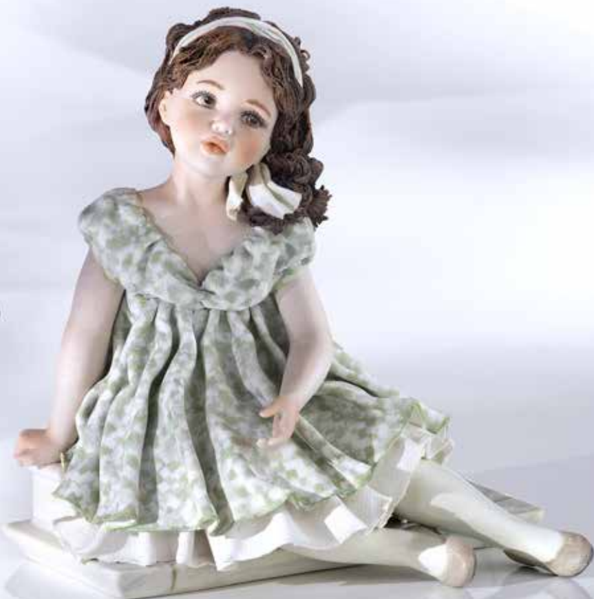
Federica - 21 cm