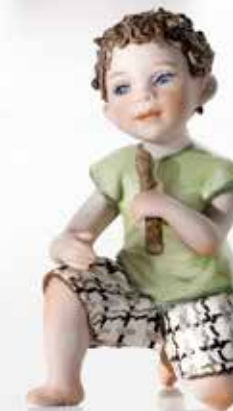
Enzo - 8,5 cm