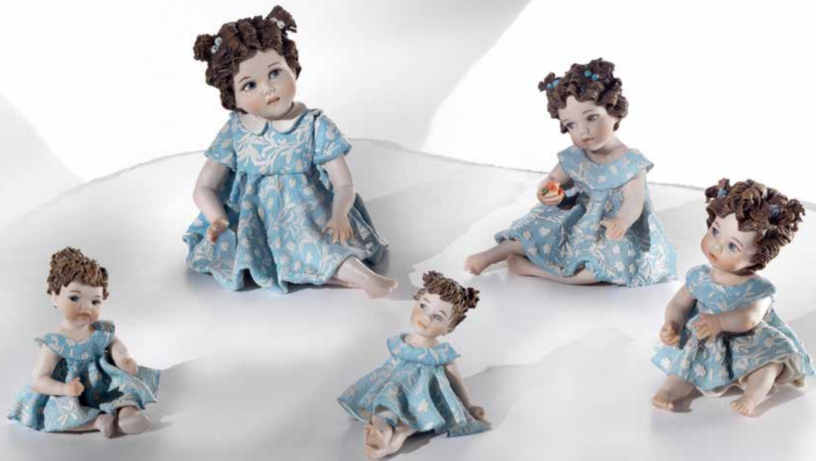
Clio - 8 cm