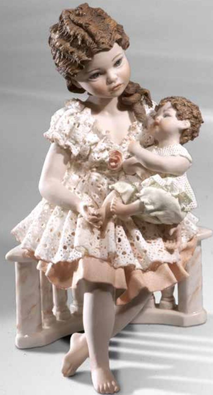
Luna con bimbo - 25 cm