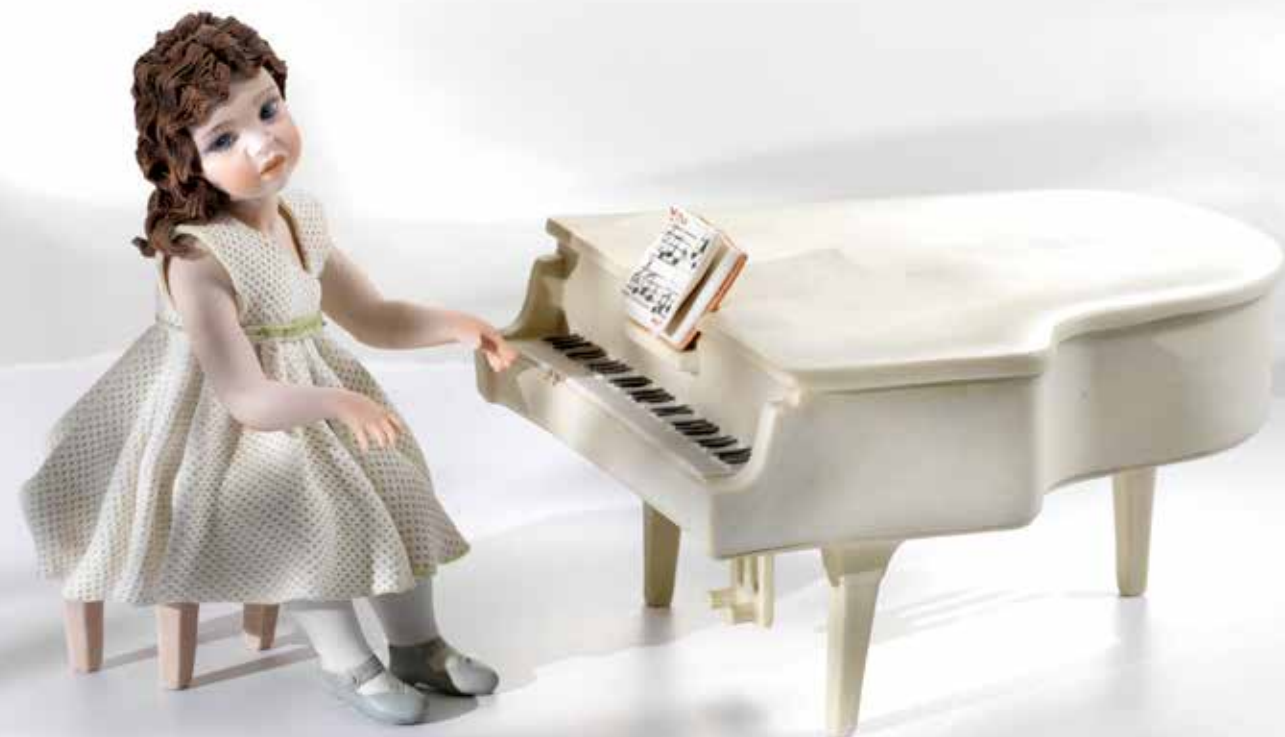
Cecilia - 18 cm