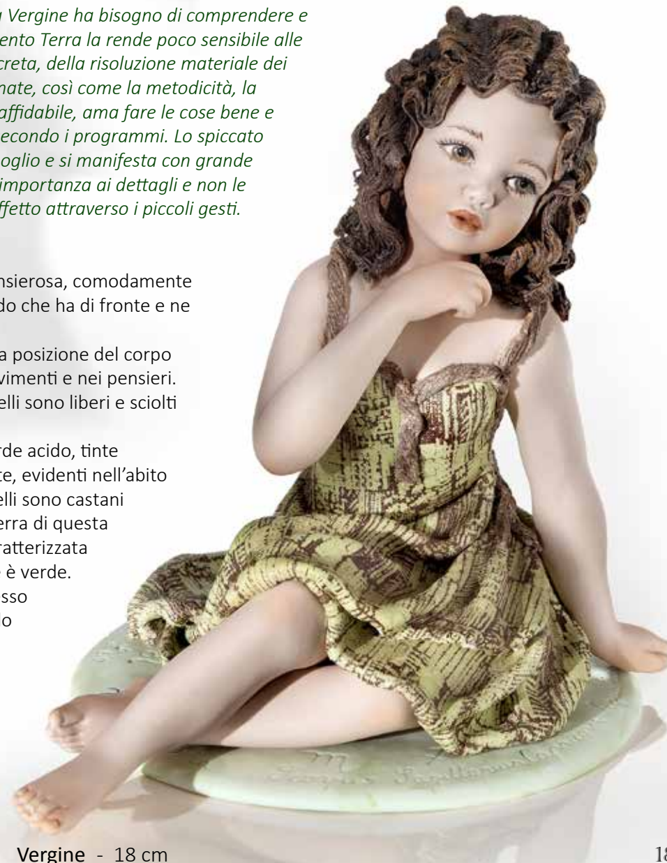
Vergine - 18 cm