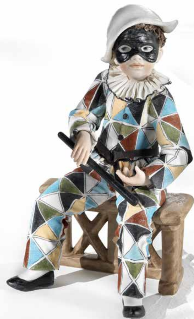
Arlecchino medio - 28 cm