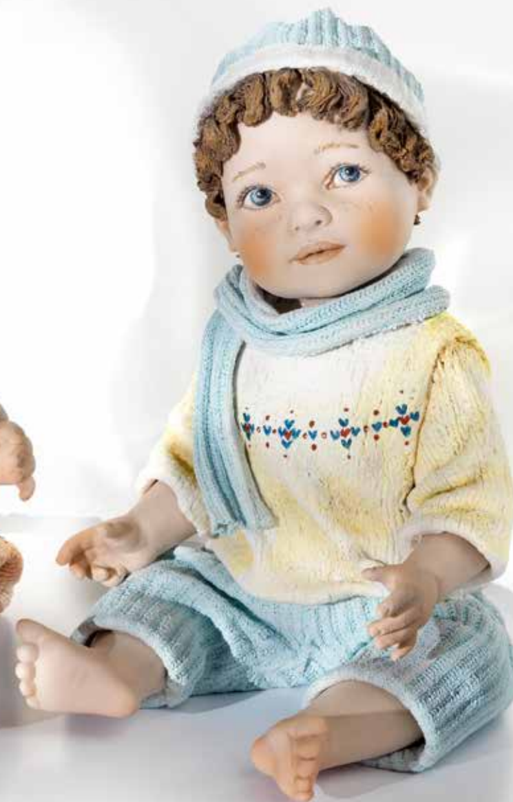
Arty - 20 cm