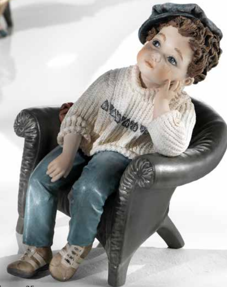
Piero - 25 cm