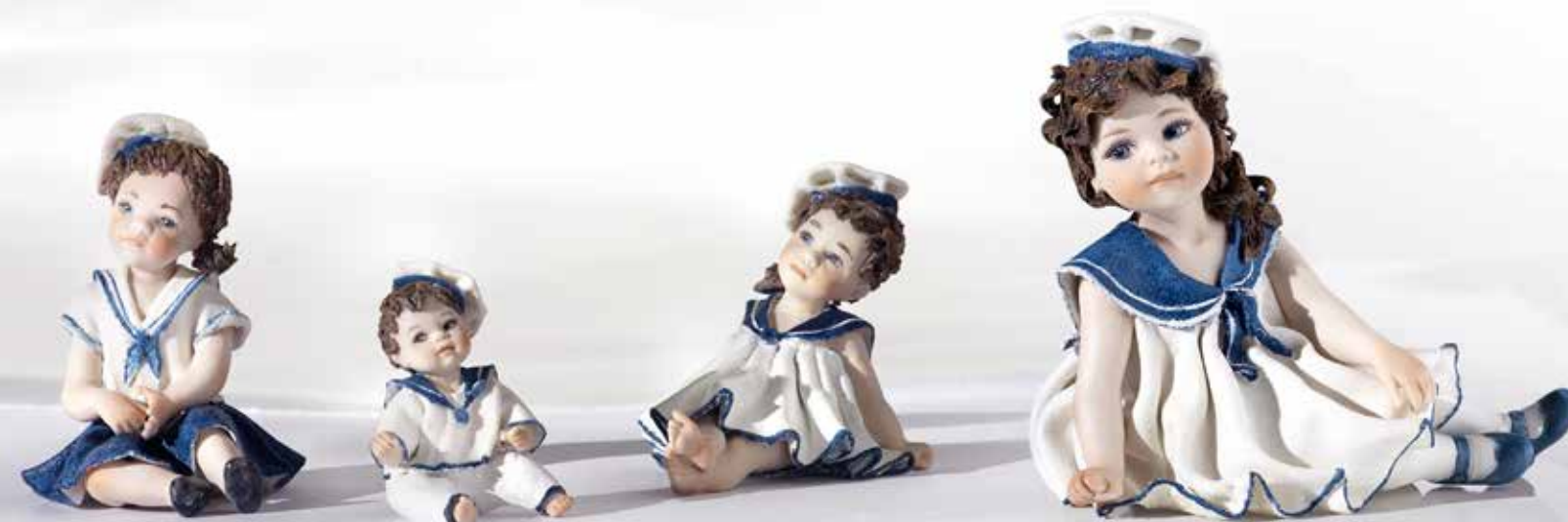
Goletta - 9 cm