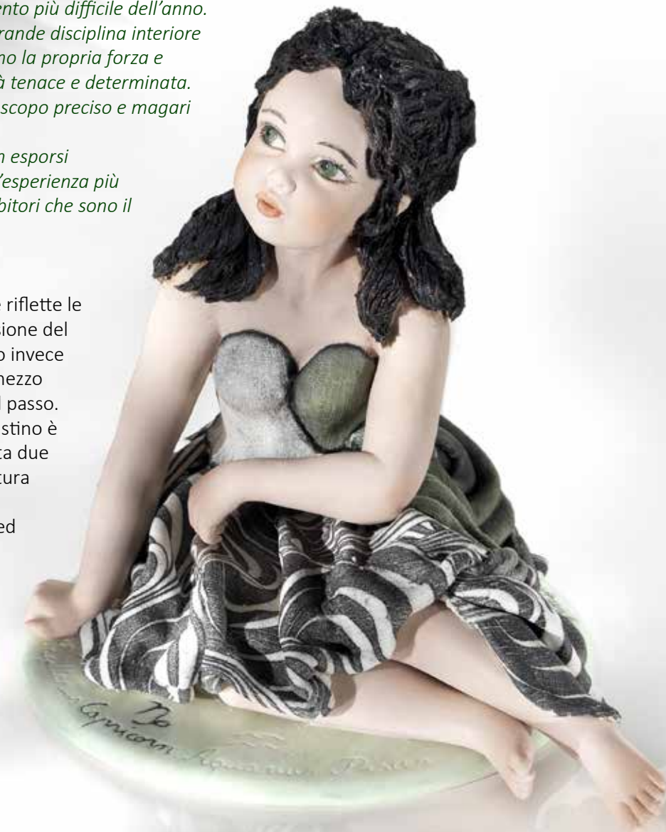
Capricorno - 18 cm