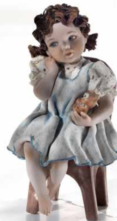
Nicoletta - 17 cm