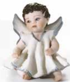
Angelo 33 A - 7,5 cm