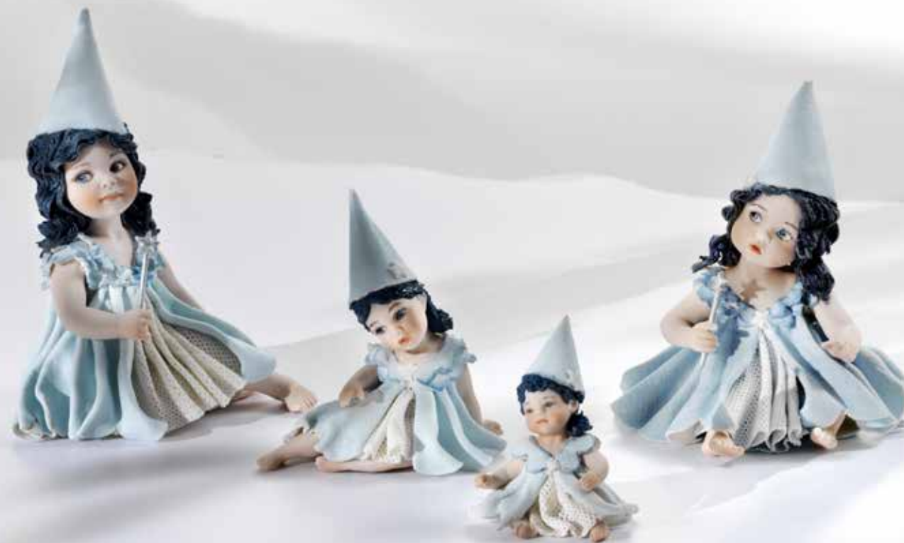
Fata Turchina mignon - 6,5 cm