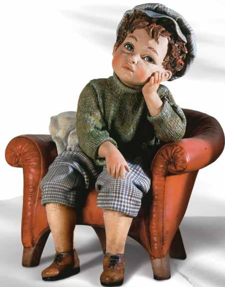
Francesco - 25,5 cm