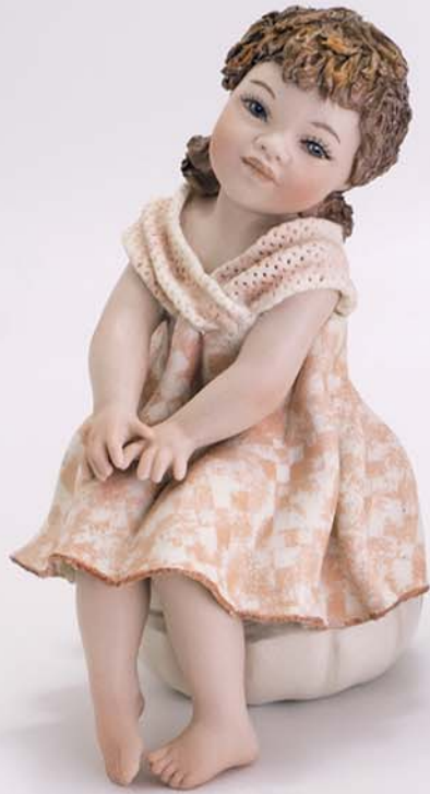
Moira 17.5 cm