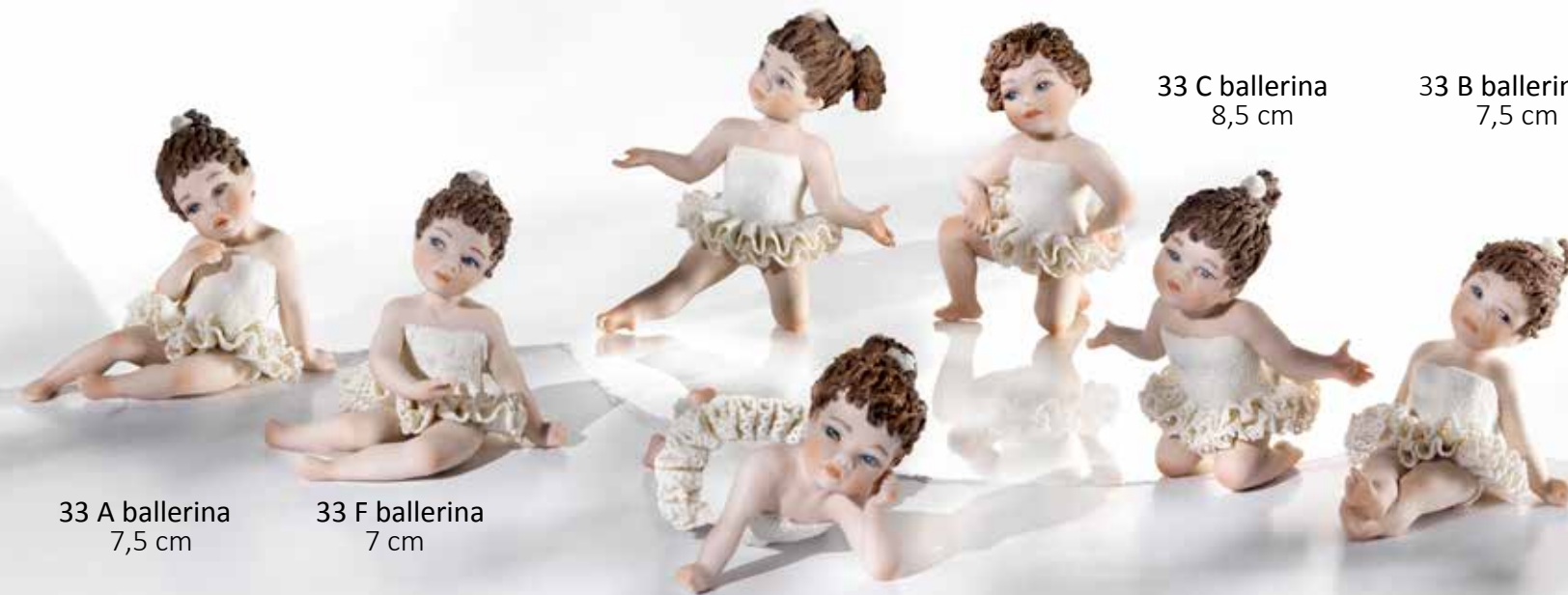
33 A ballerina 7,5 cm