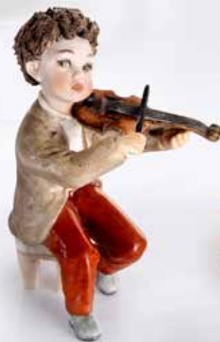
Vito - 10,5 cm