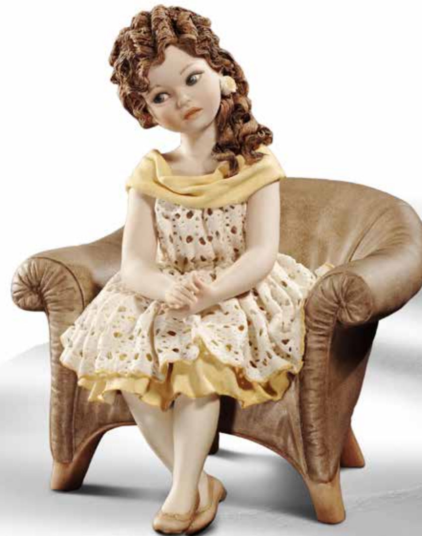
Clara - 25 cm