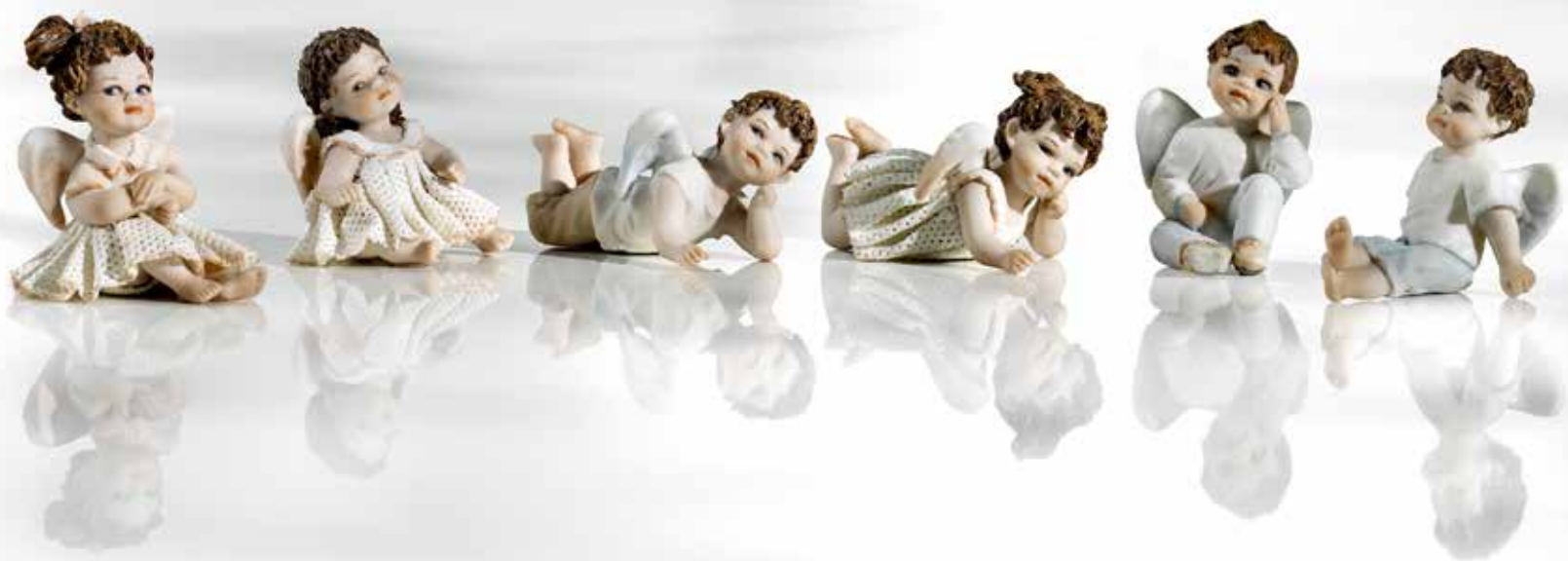
144 Cloe - 6 cm Ebe - 5,5 cm