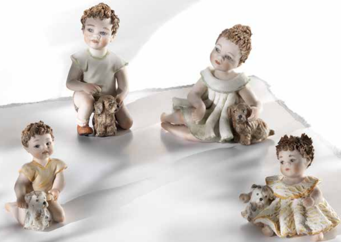
Lucy - 7,5 cm