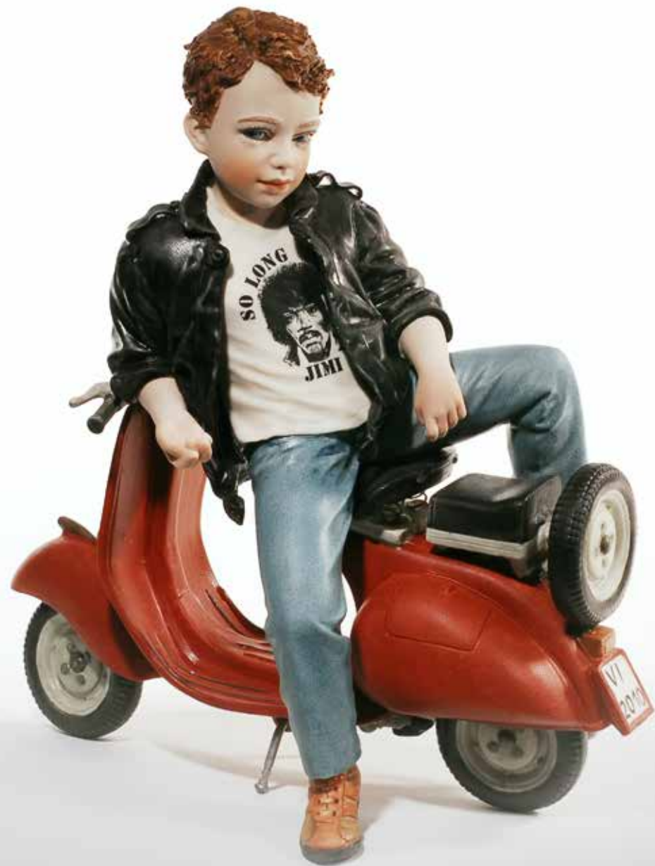
Ringo - 29 cm