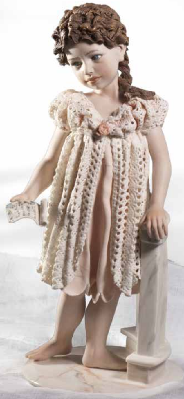
Lavinia - 36 cm