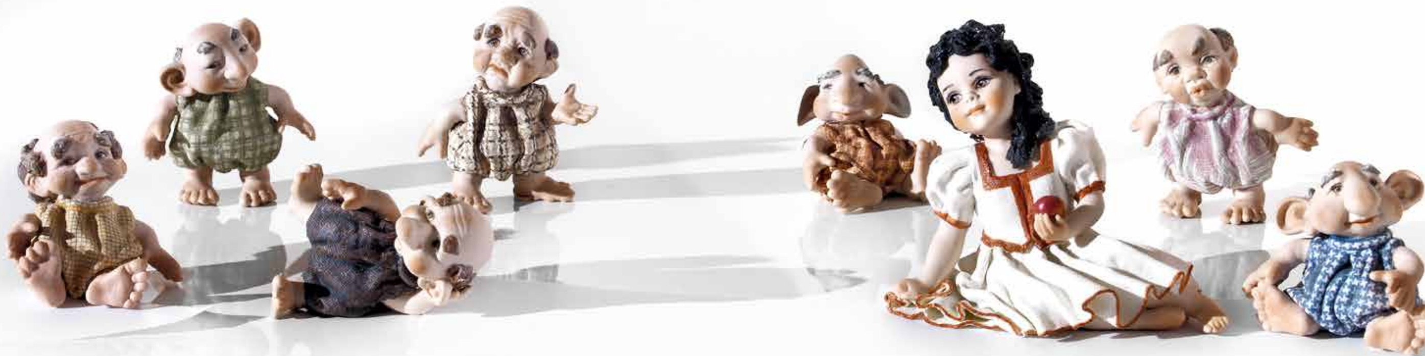
Nano Viola - 9 cm