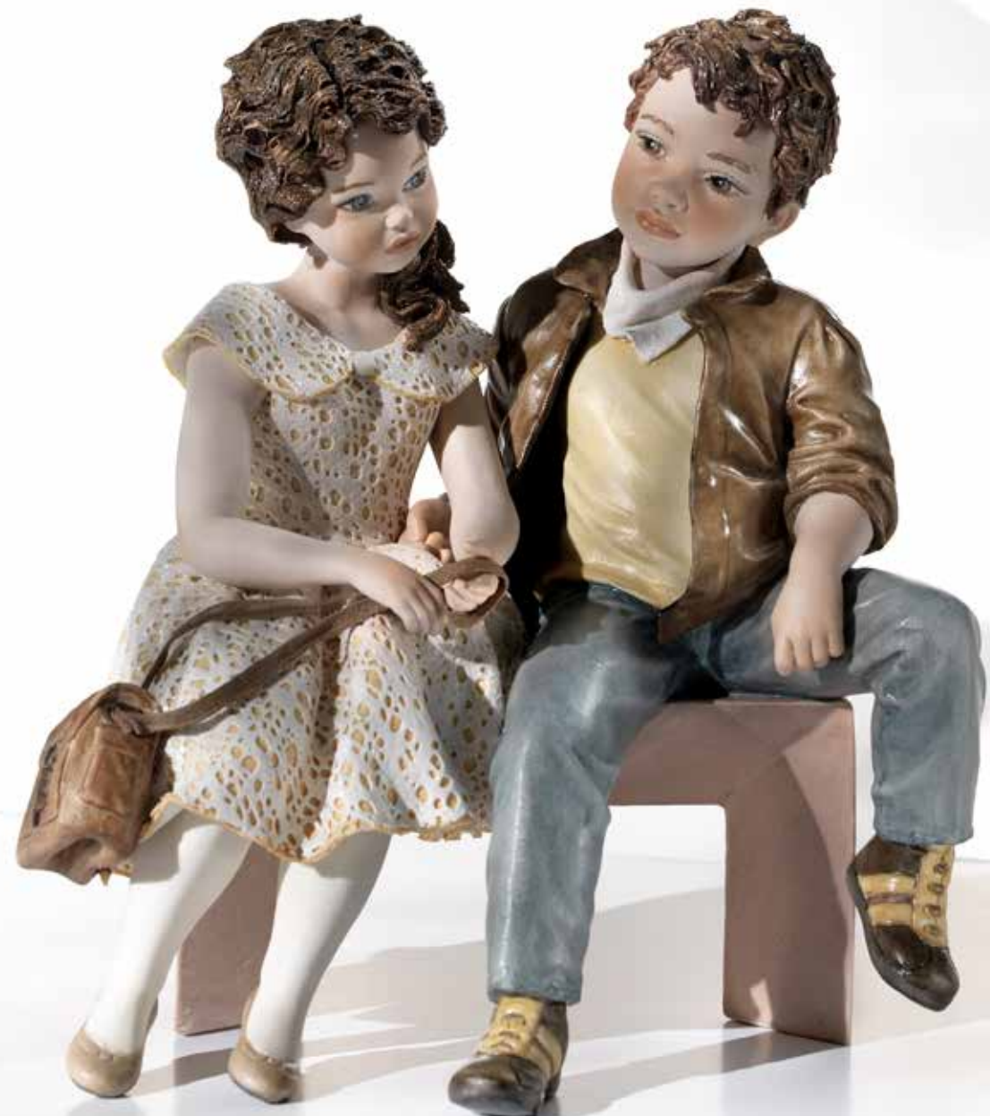
Incontrarsi - 26 cm