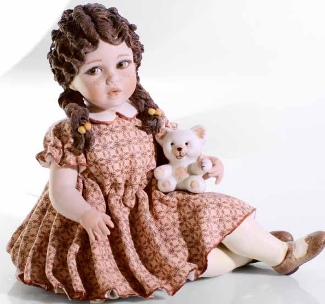
Sofia - 17,5 cm