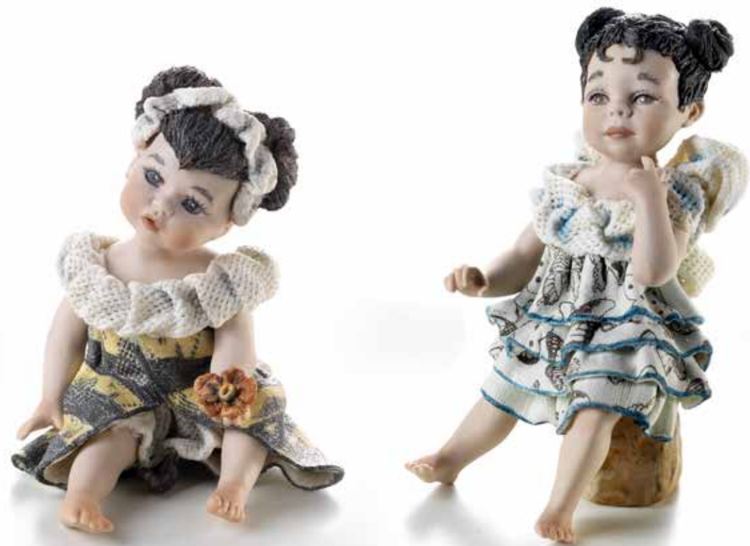
Bee (l'apetta) - 11 cm