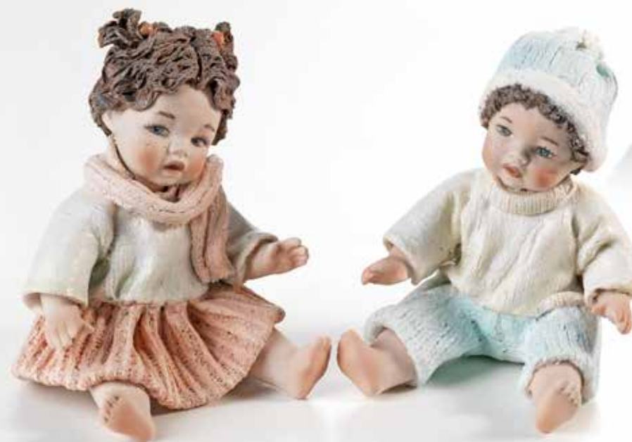
Sue - 10,5 cm