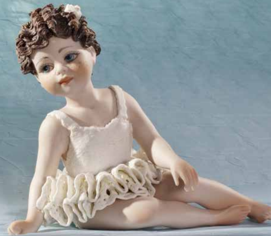
Orthencine - 12 cm