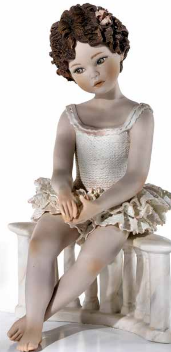
Linda - 25 cm