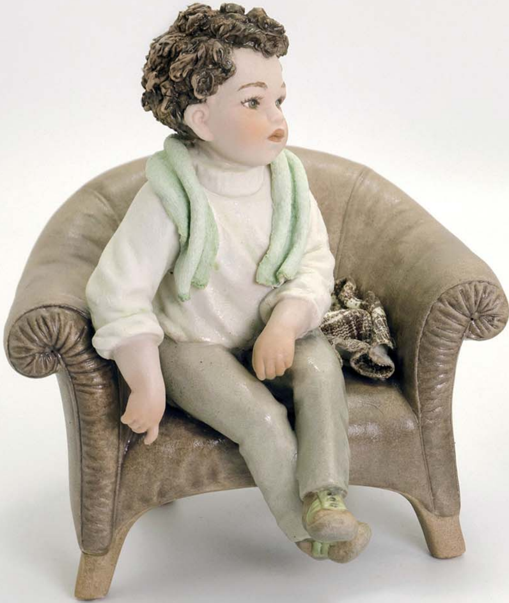
Giulio 17.5 cm