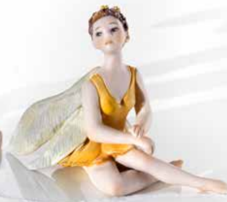
Campanellino - 7 cm