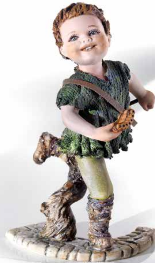
Peter Pan - 17,5 cm