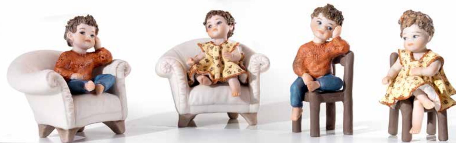
Renzo - 8,5 cm