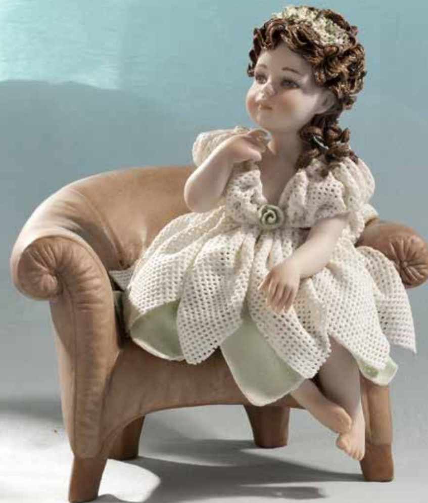
Giulietta - 18 cm