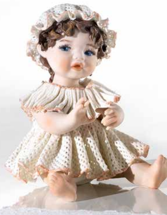
Adelina - 10,5 cm