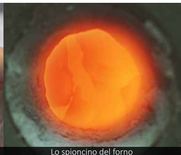
Lo spioncino del forno