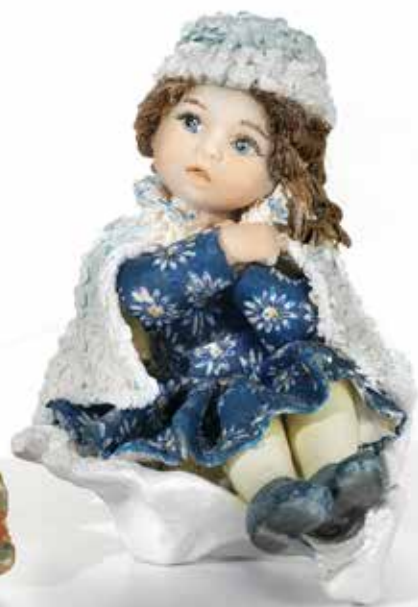
Inverno - 11 cm