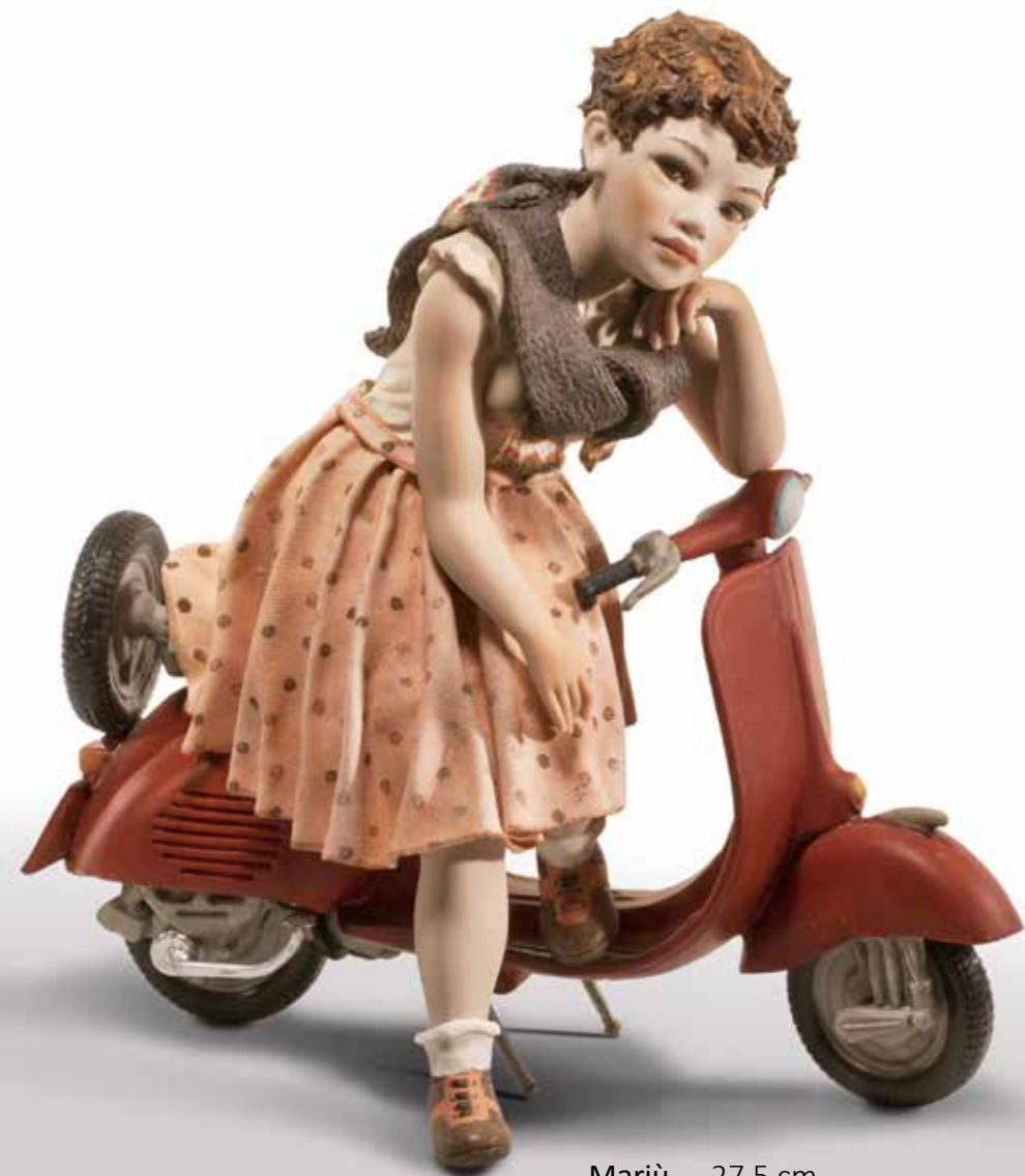
Mariù - 27,5 cm