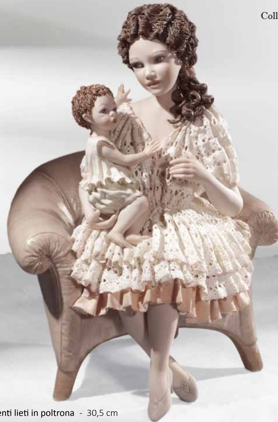
Momenti lieti in poltrona - 30,5 cm