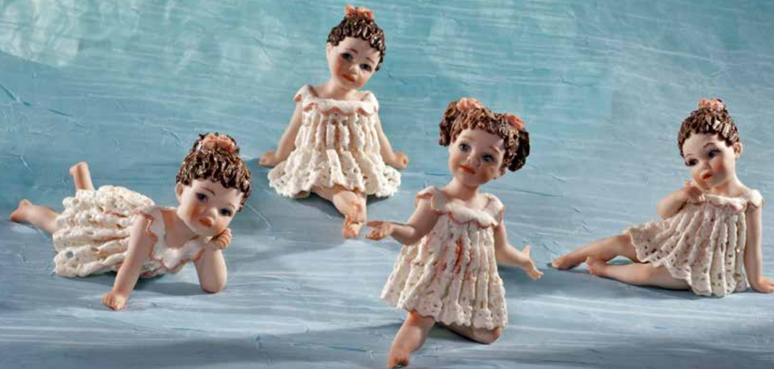
Sally - 6 cm