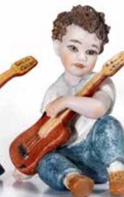
Steve - 8 cm