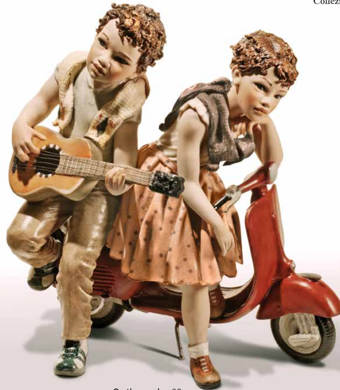
On the road - 30 cm