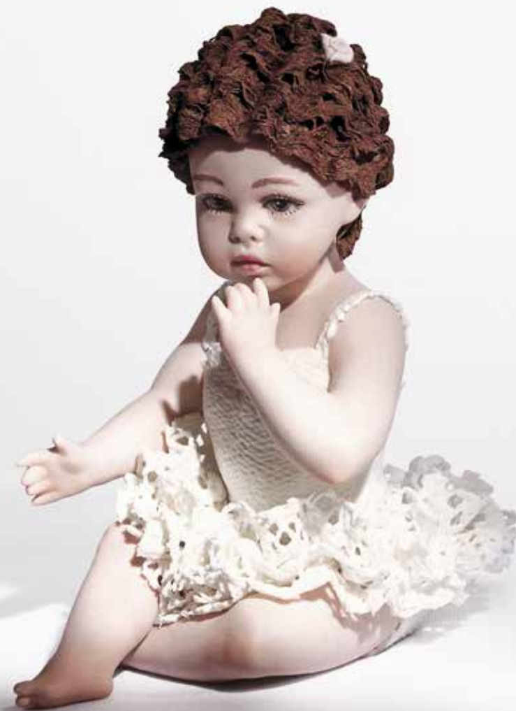
Joujou - 16 cm