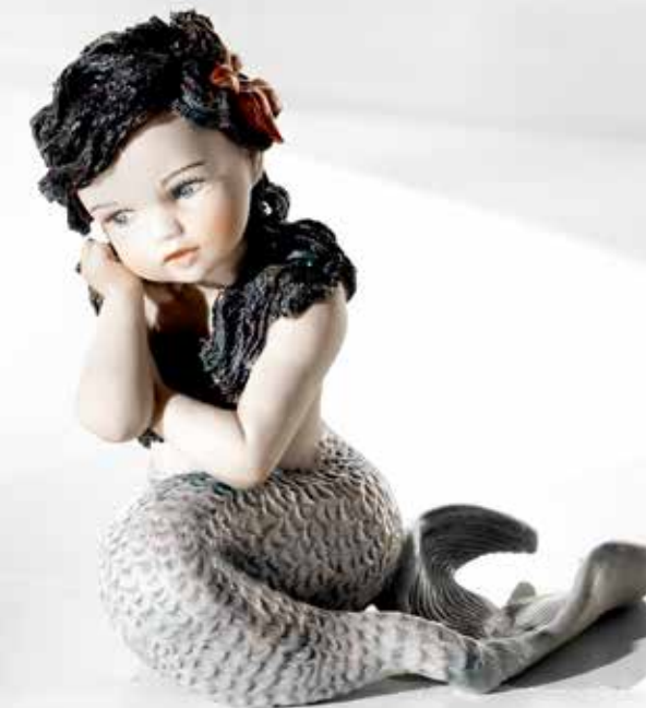
La sirenetta - 12 cm