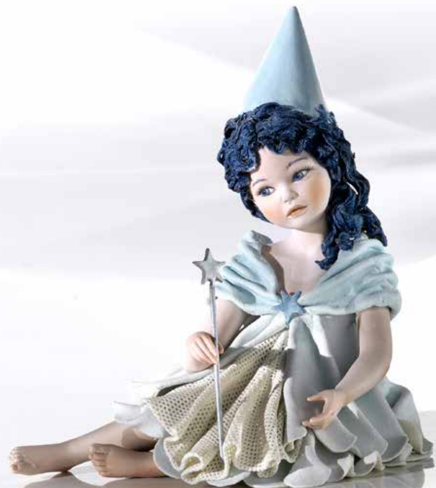
Fata Turchina 5 - 22 cm