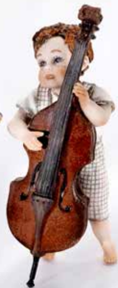
Beppe - 13,5 cm