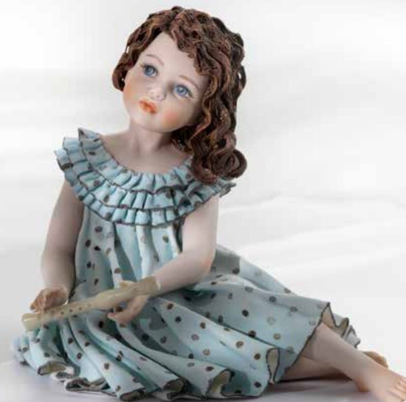
Pamina - 17 cm