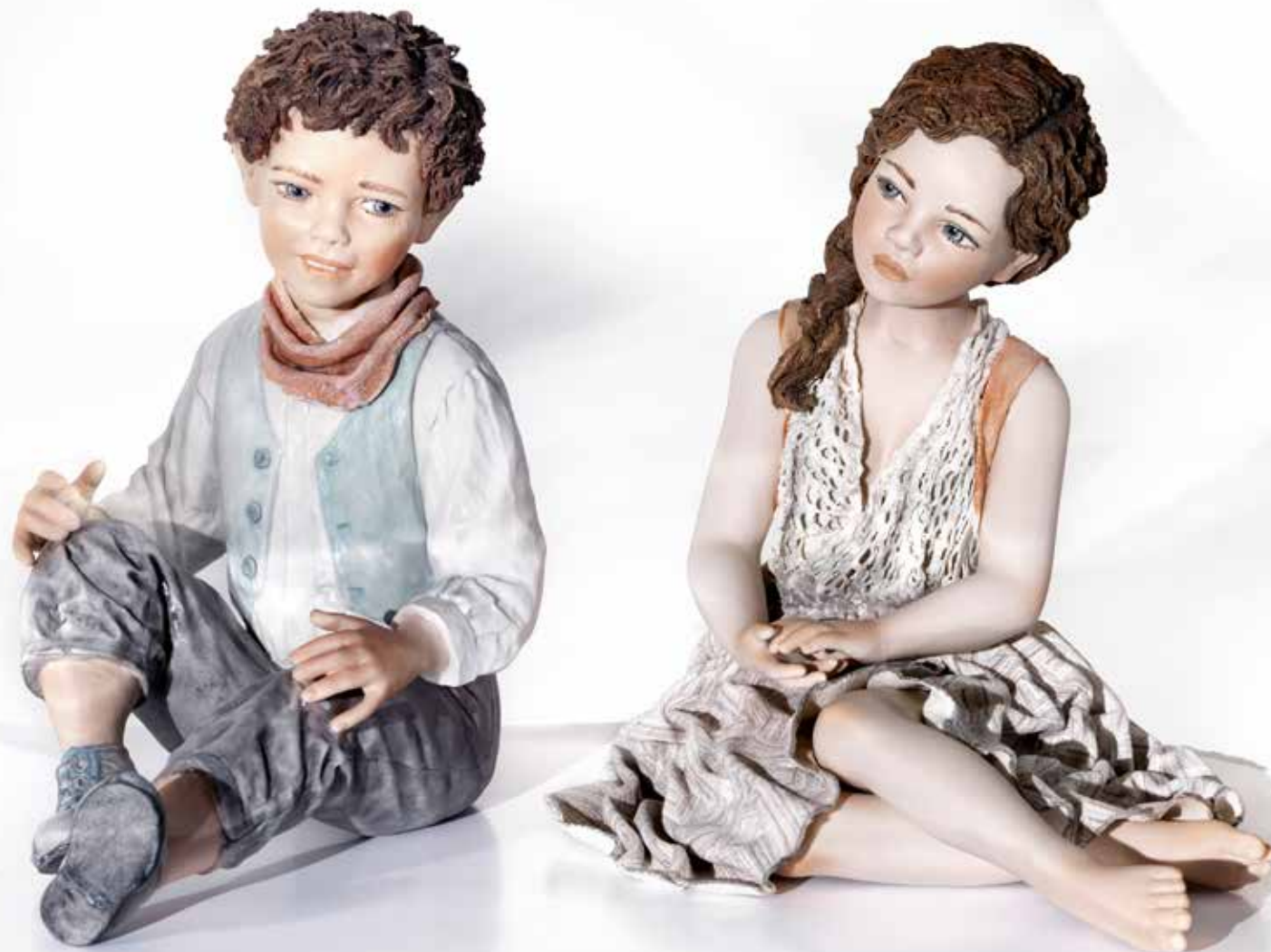
Matteo - 23 cm