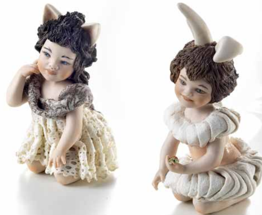
Catty (il gattino) - 13 cm