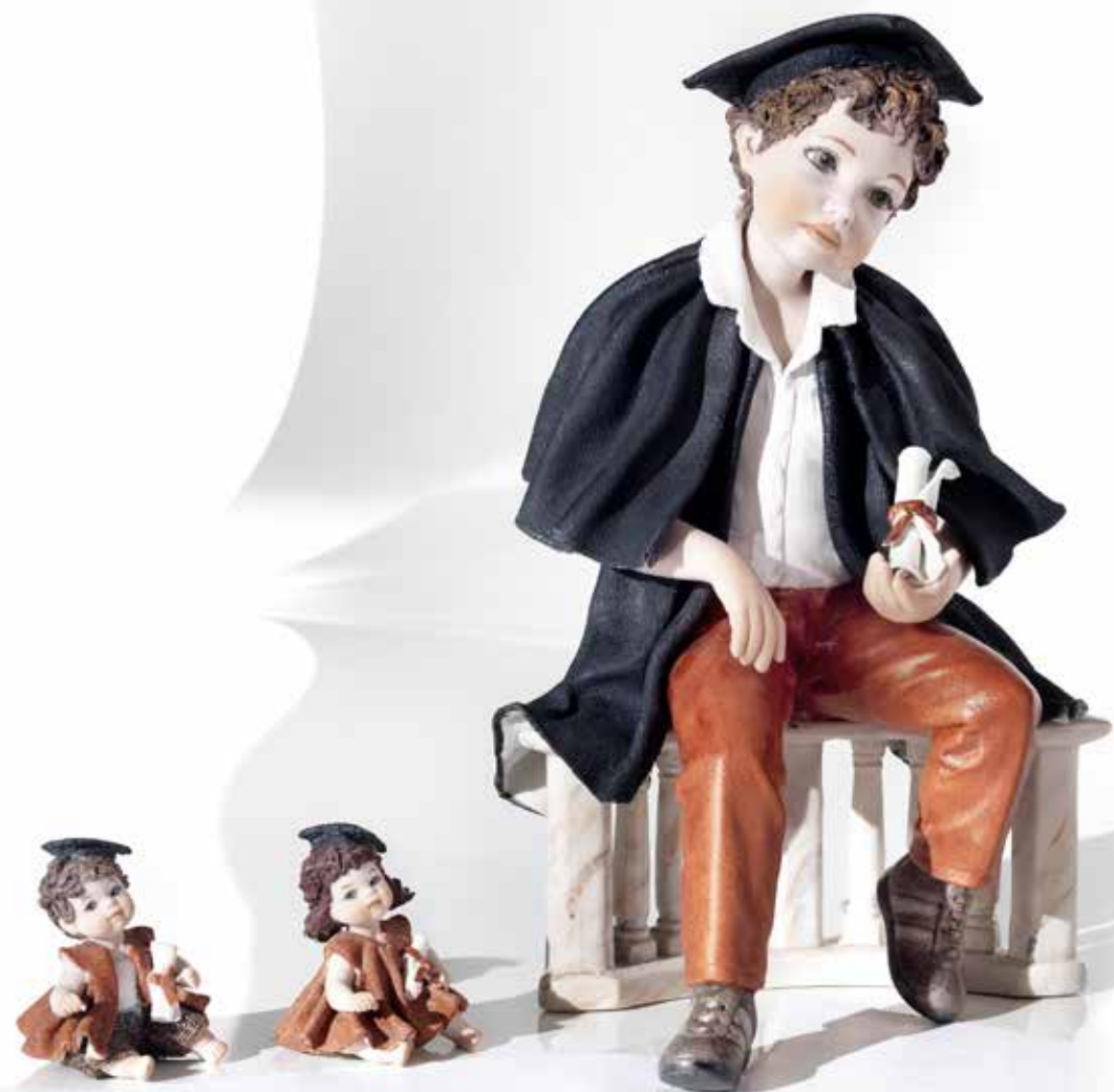
146 Mignon laurea M e F - 6 cm Filippo laureato - 27,5 cm