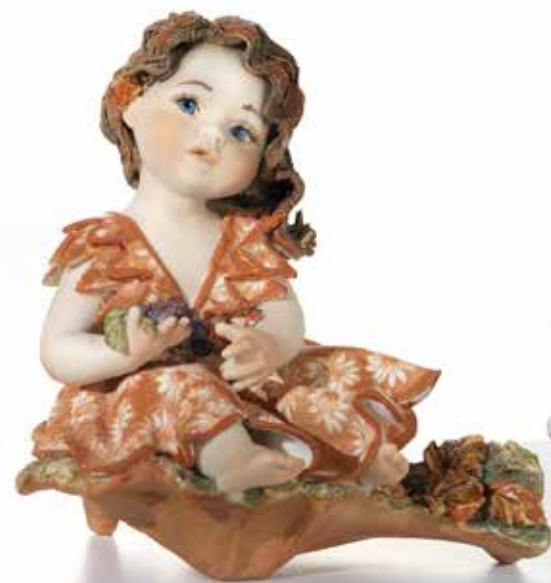
Autunno - 12 cm