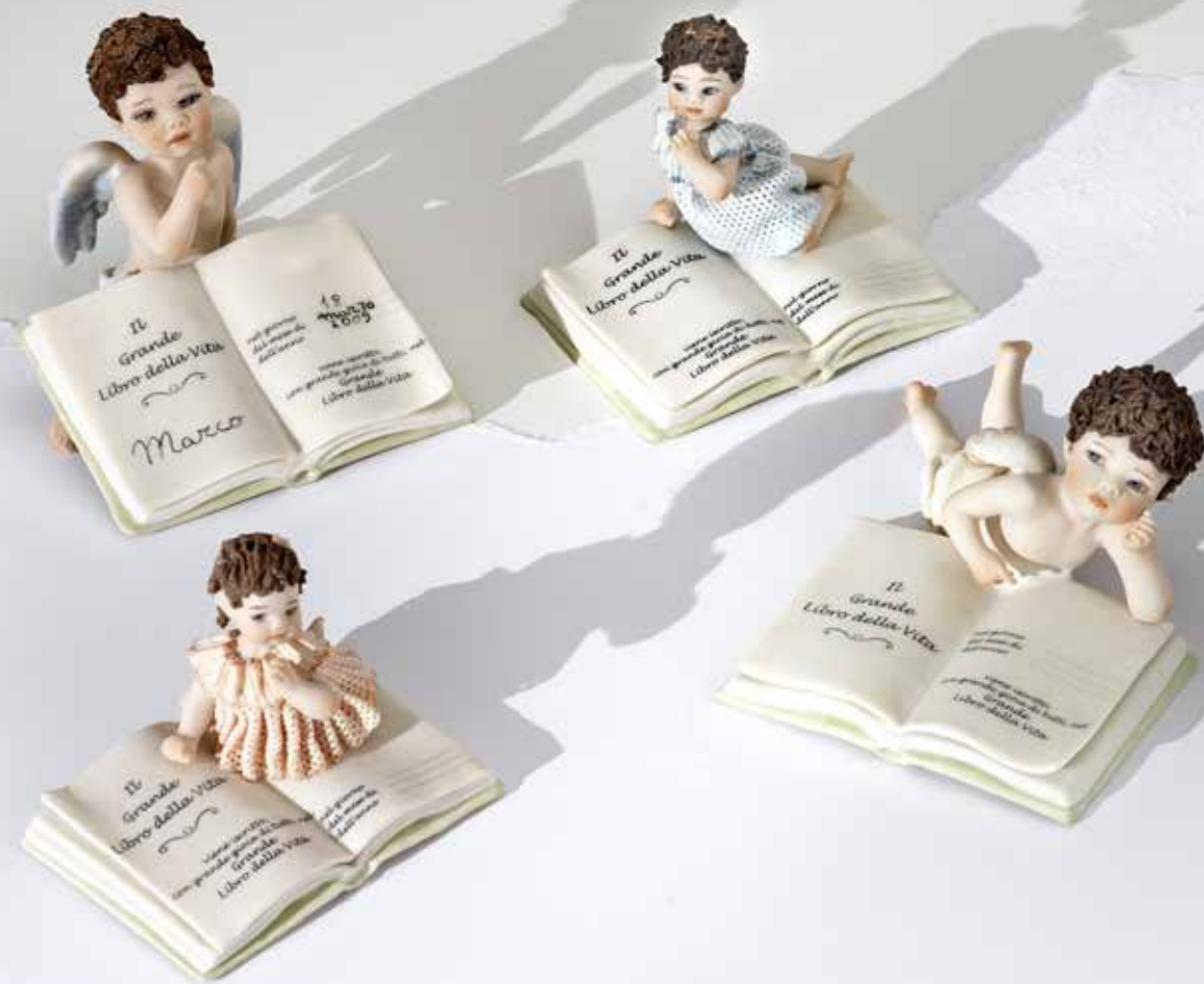
Libro della Vita F - 6,5 cm