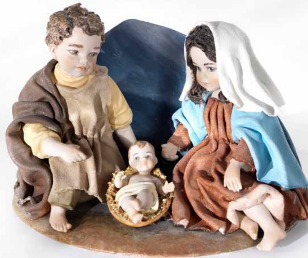
Presepe 2 - 14,5 cm