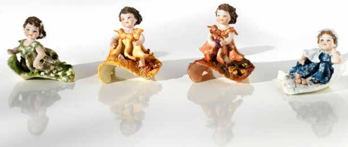
Mignon Primavera - 7 cm Mignon Estate - 7,5 cm Mignon Autunno - 8,5 cm Mignon Inverno - 6,5 cm 161