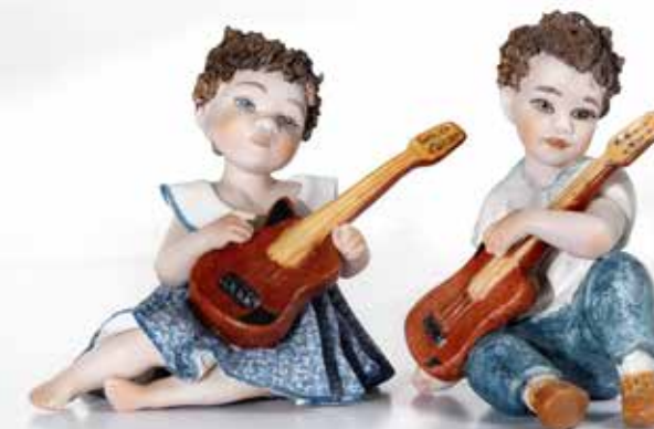
Stella - 7,5 cm