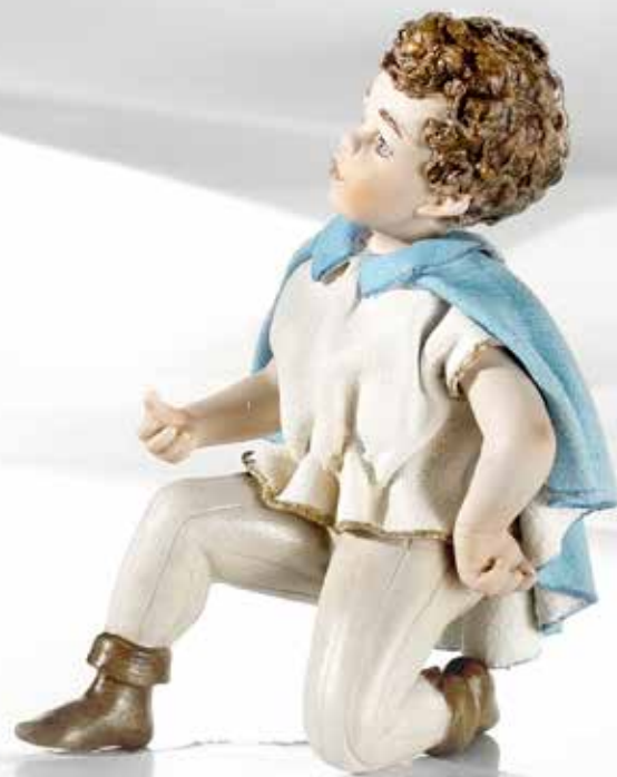
Principe azzurro - 13,5 cm