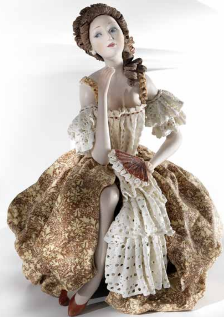
Dama 5 - 29 cm