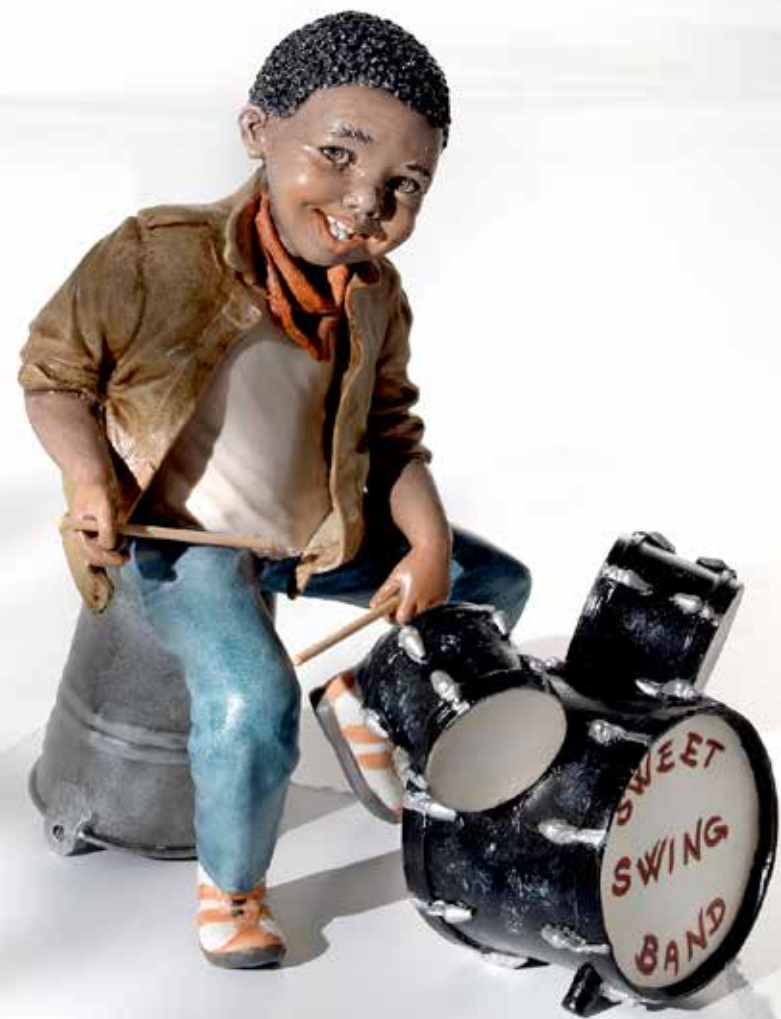
Billy - 25,5 cm