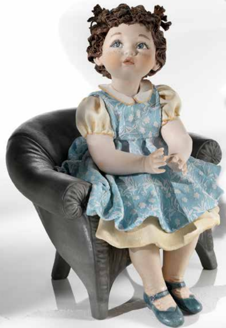
Pierina - 25 cm