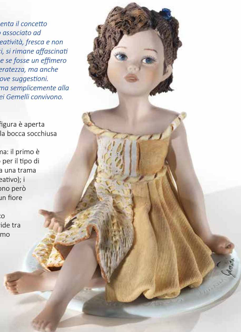
Gemelli - 18 cm

Sul corpetto è mascherato il simbolo del segno, che di nuovo si divide tra elementi verticali puliti e lineari e orizzontali arricciati.