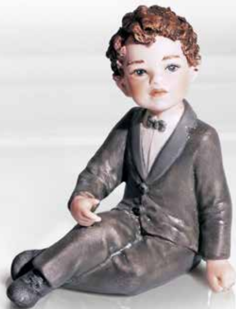
138 Comunione 8 - 12,5 cm