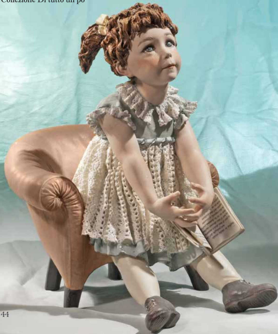
Emily su poltrona - 32 cm