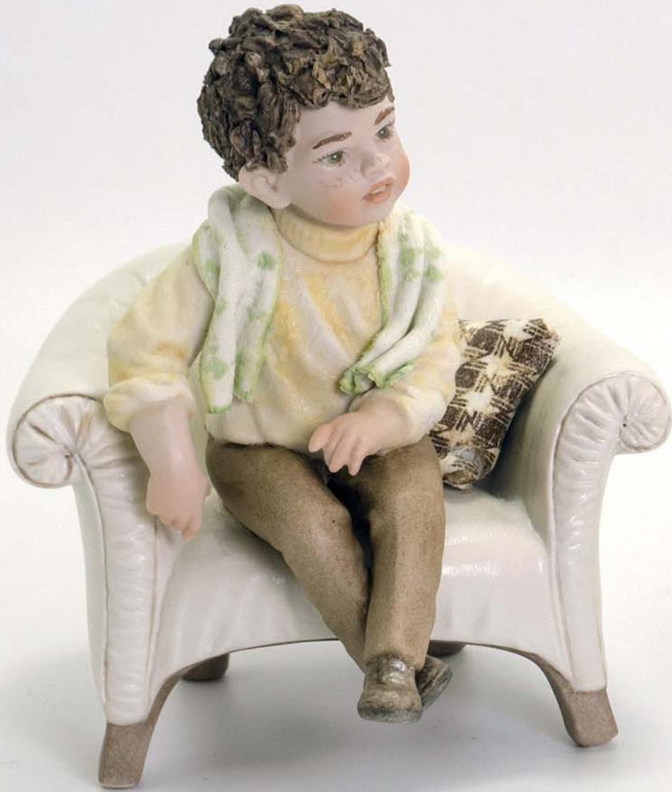
Lele 16 cm