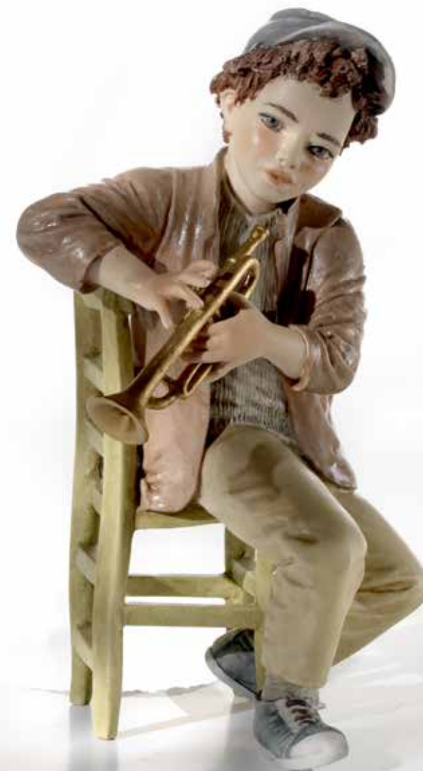
Davis - 29 cm