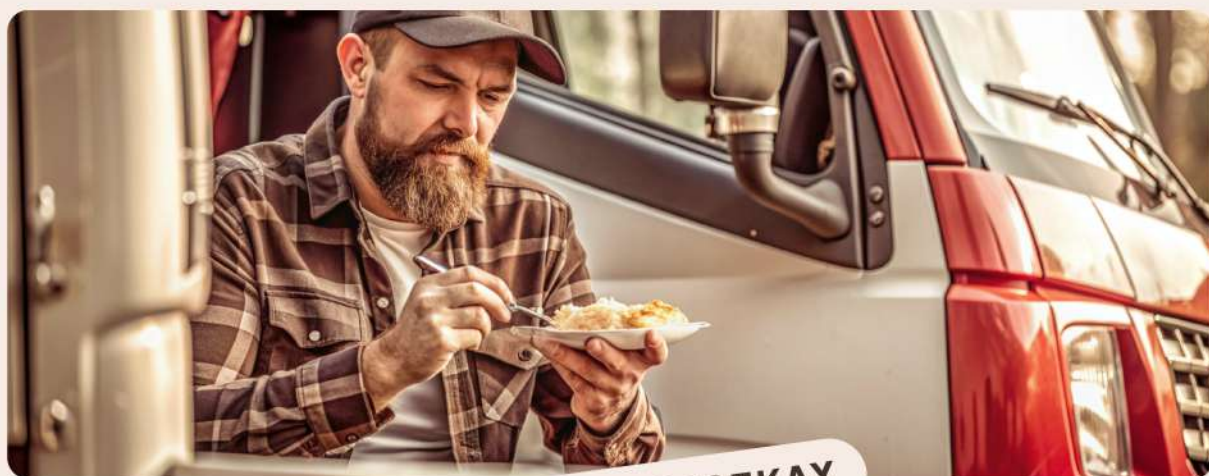
В ДАЛЬНИХ ПОЕЗДКАХ