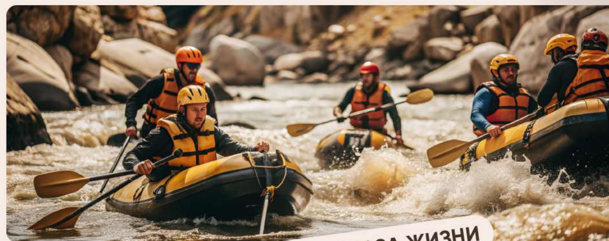
ДЛЯ АКТИВНОГО ОБРАЗА ЖИЗНИ