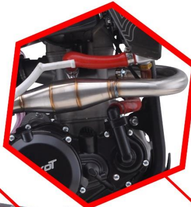
ВЫХЛОПНАЯ ТРУБА ИЗ НЕРЖАВЕЮЩЕЙ СТАЛИ С РЕЗОНАТОРОМ POWERBOMB