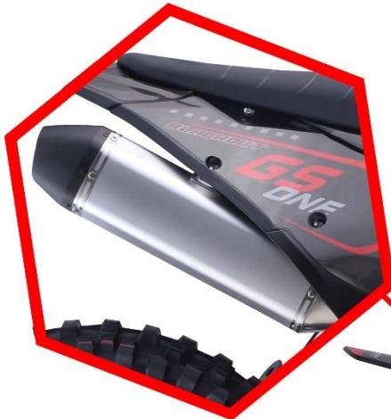
Алюминиевый глушитель FMF