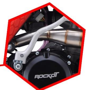
АЛЮМИНИЕВАЯ ЛАПКА КИК-СТАРТЕРА