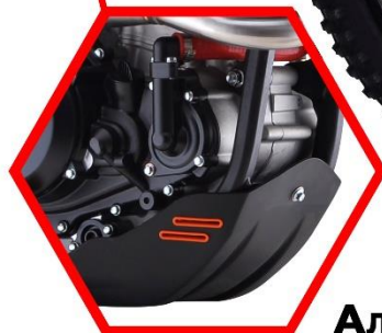
АЛЮМИНИЕВАЯ ЗАЩИТА ДВИГАТЕЛЯ