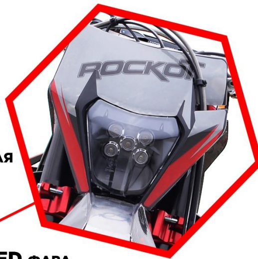
LED ФАРА НОВОГО ПОКОЛЕНИЯ С 5 ЛИНЗАМИ