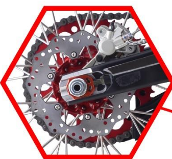
Тормозной диск 220 мм