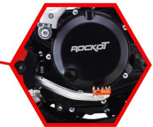
АЛЮМИНИЕВАЯ ЛАПКА ЗАДНЕГО ТОРМОЗА