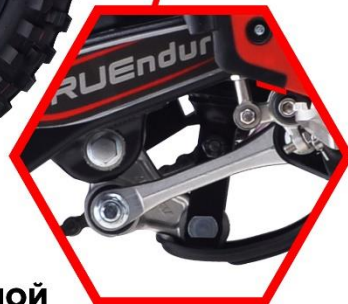
ПРОГРЕССИВНАЯ С РЫЧАЖНОЙ СИСТЕМОЙ