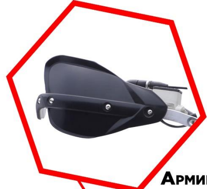
АРМИРОВАННАЯ ЗАЩИТА РУК