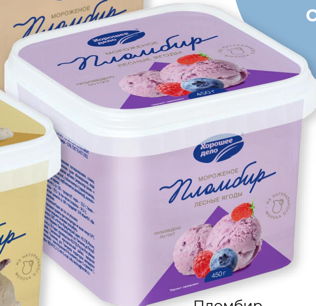
Пломбир с наполнителем «Лесные ягоды» 450 г