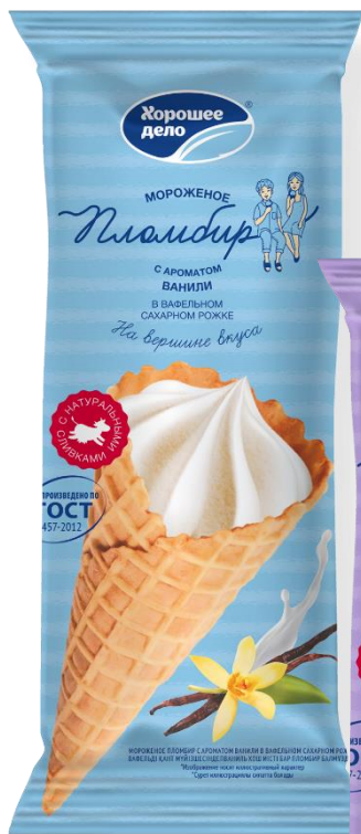
Пломбир с ароматом ванили в вафельном сахарном рожке 110г