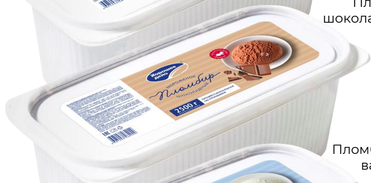
Пломбир шоколадный 2,2кг