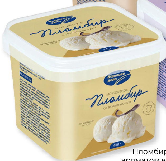
Пломбир со ароматом ванили 450 г