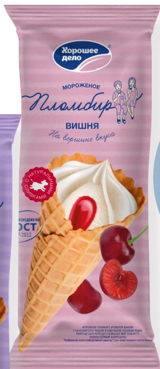
Пломбир с ароматом ванили с наполнителем «Вишня» в вафельном сахарном рожке 110г

Идеальный выбор для тех, кто хочет насладиться вкусом детства