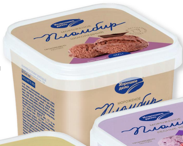
Пломбир шоколадный 450 г