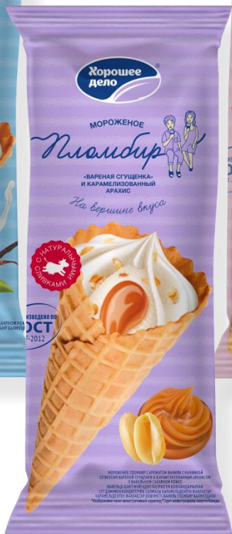
Пломбир с ароматом ванили с начинкой со вкусом вареной сгущенки и карамелизованным арахисом в вафельном сахарном рожке 110г