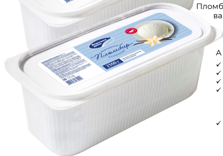
Пломбир с ароматом ванили 2,2 кг